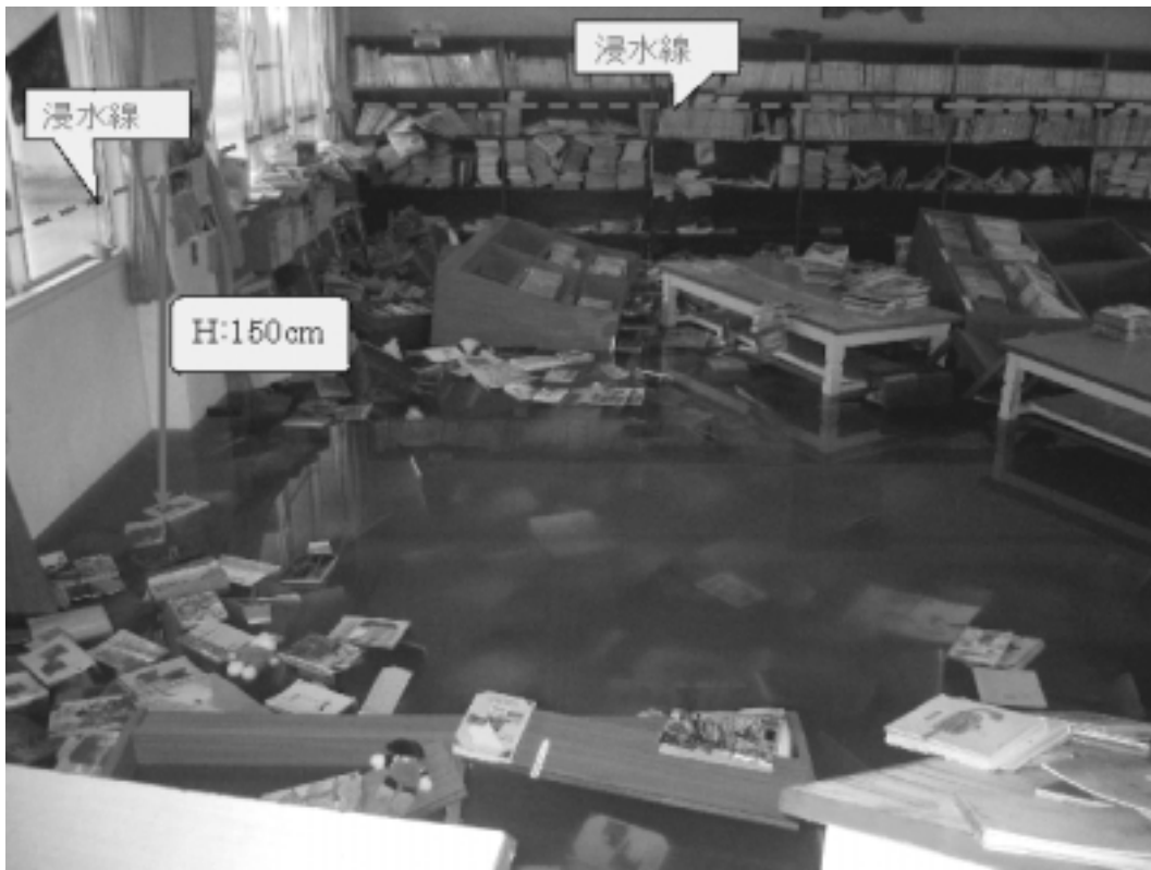
湧水町立吉松小学校 図書室（床上浸水により図書汚損）