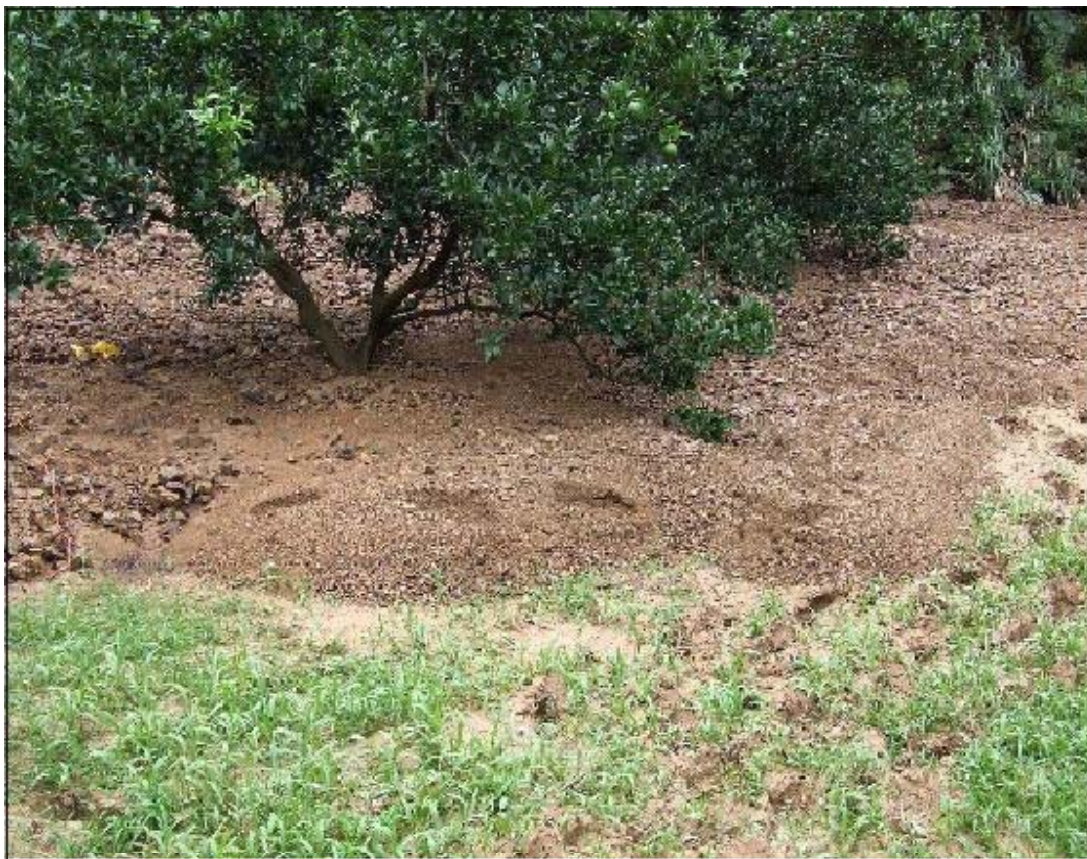
法面が崩壊し大量の土砂が流れ込んだたんかん園（龍郷町）