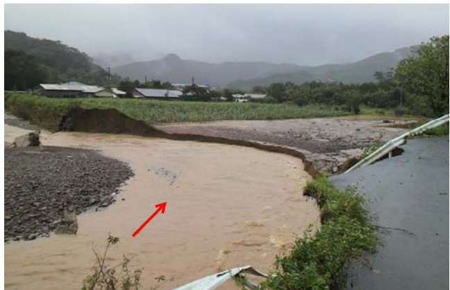
大美川の破堤状況（龍郷町大勝）