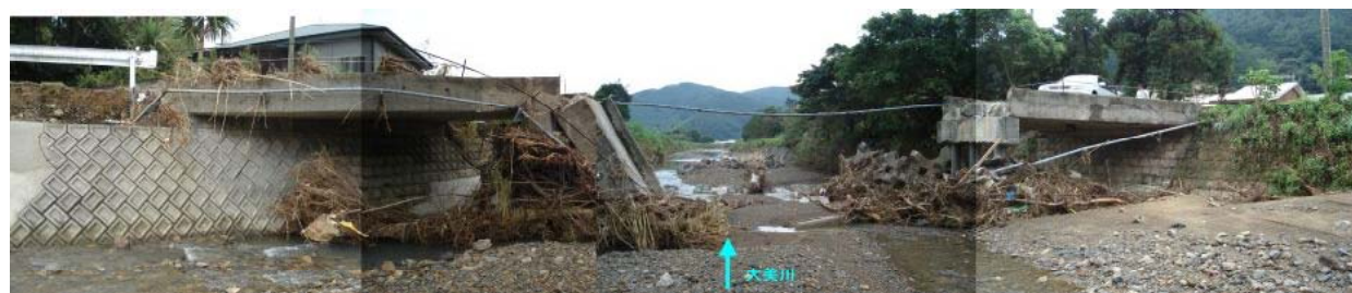
町道 千田袋線 千田袋橋 (龍郷町大勝地内)