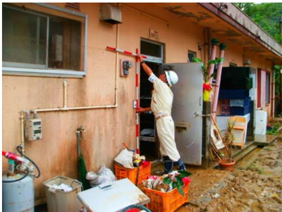
大美川の氾濫状況（龍郷町戸口）