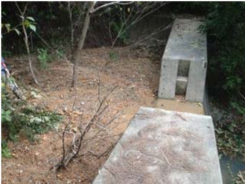
(治山施設の土砂捕捉状況)