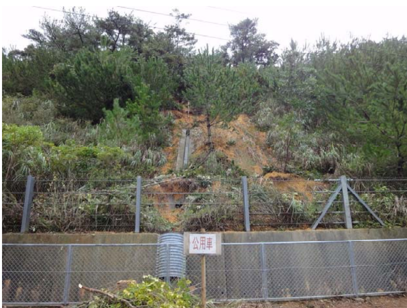
(治山施設の土砂捕捉状況)