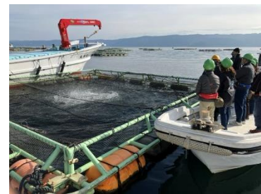
ブリ・カンパチへの餌やり体験