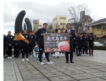
清水エスパルス歓迎式（R6.1.31） 激励品として「鹿児島黒牛」を 贈呈しました。

※ 薩摩おいどんカップ 2024 開催中！ ⇒ https://oidoncup.com