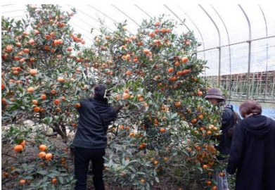
桜島小みかん収穫体験

鹿児島地域には魅力的な農林水産物がたくさんあります。皆さんにもっともっと知っていただけるよう取り組んでいきます。