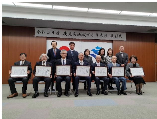
受賞された個人・団体の皆様