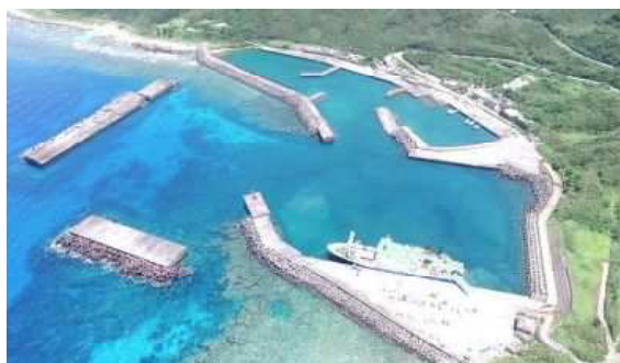
西之浜漁港(口之島)に接岸中のフェリーとしま2