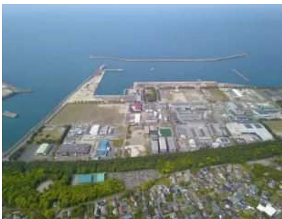
いちき串木野市の工業団地

鹿児島市の中心部を除く本土区域（日置市やいちき串木野市等）においては、人口減少等によって労働力不足や都市・集落機能の低下等が顕在化しており、産業の振興はもとより農林水産業の6次産業化や担い手の確保・育成、新卒者等の地元就労の促進、小さな拠点づくり、資金の地域外流出を防ぐ地域経済循環の促進などに取り組み、地域の活性化を図っていかねばなりません。