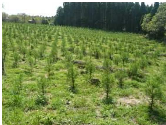
再造林を終えた森林