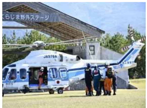
桜島火山爆発総合防災訓練

現在、鹿児島地域においては、地元の市村が中心となって、このような事態を想定した避難訓練、住民への迅速で丁寧な防災情報等の提供や避難所の確保・運営などを実施するとともに、国や県、市村が連携して河川や急傾斜地等の改修を計画的に進め、災害の予防・軽減が図られるよう取り組んでいます。