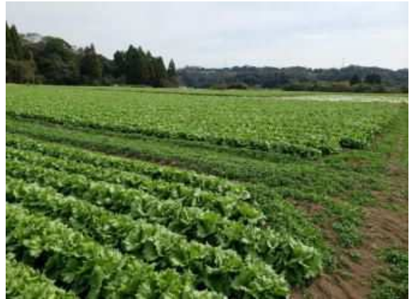
水田活用のレタス栽培