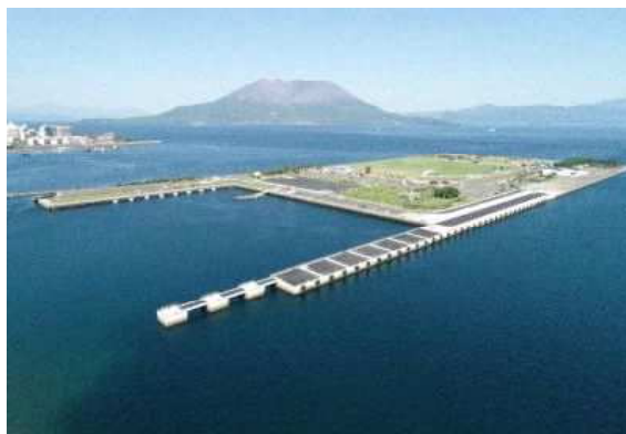
マリポートかごしま