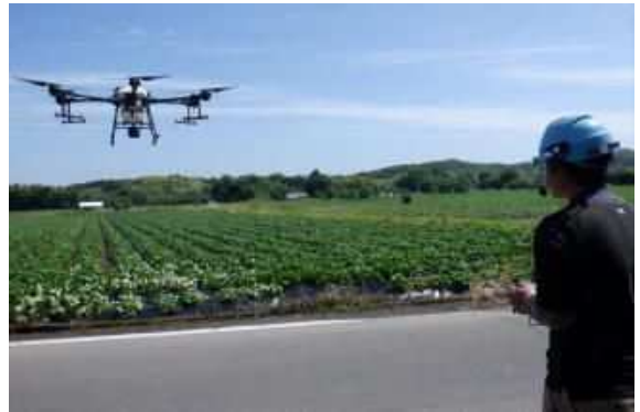
ドローンによる農薬散布