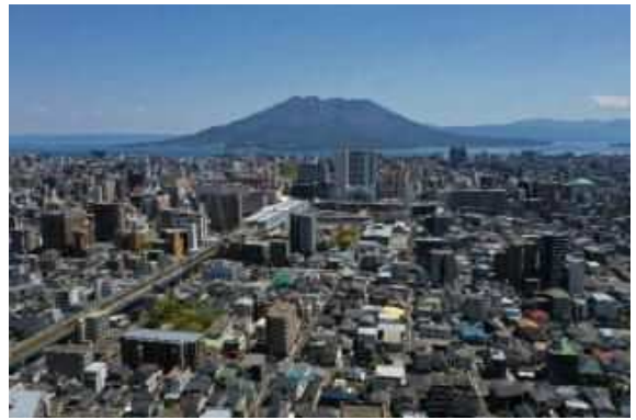
鹿児島中央駅周辺

鹿児島市の中心部は、本県における経済活動の中心地となっており、人口が減少する状況にあっても人の往来や物の流れ、街の賑わいを維持し続けるためには、幹線道路の渋滞緩和や港湾施設の機能向上等に向けたインフラの充実を図るとともに、起業や異業種交流、他地域との連携等を推進し、産業振興や地域の活性化につなげる必要があります。