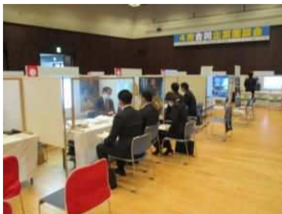
4市合同企業面談会（鹿児島市）