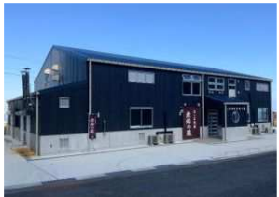
みしま焼酎 無垢の蔵