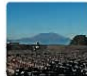
黒砂つぼ湯 (桜島市)