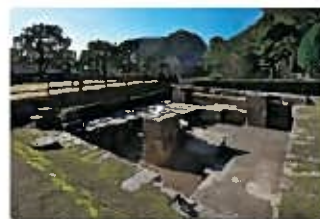
旧集成館(反射炉跡)

旧集成館、寺山炭窯跡、関吉の疎水溝は、幕末から明治期の重工業における急速な産業化の道程を証言する産業遺産群の構成資産であり、九州・山口を中心とする8県11市の23の資産で構成される世界文化遺産として、2015年7月に登録されました。