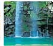
瀬川の滝 (前大隅町)