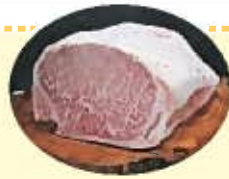
全国和牛能力共進会チャンピオン牛(第9区(去勢・肥育)肉)