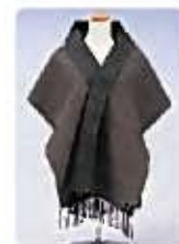
大島紬を使用した カシミアストール