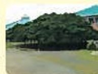
沖永良部のガジュマル (枝張り22.5mで日本一)