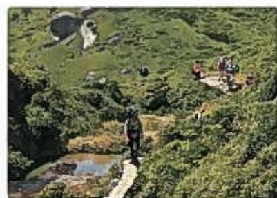
トレッキングの様子(屋久島町)