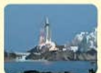
種子島宇宙センター