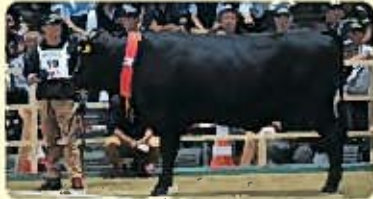
肉用牛(黒毛和種) ※全国和牛能力共進会チャンピオン牛(第1区(若雄))