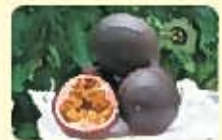
パッションフルーツ