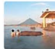
たまたげ温泉 (指宿市)