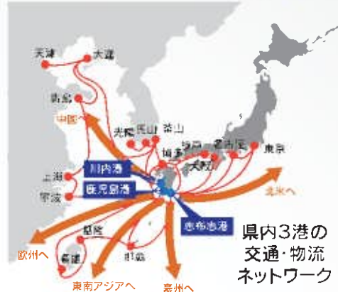
県内3港の交通・物流ネットワーク