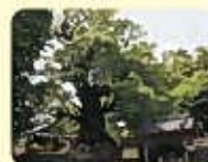
蒲生の大楠 (樹回り33mの日本一大きな木)