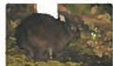
アマミノクロウサギ