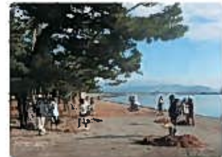
重富海岸の清掃イベントの様子 (写真提供: NPO法人「くさの自然塾」)