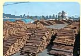
志布志港野積場の木材