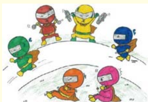
ケンゾウ(健増)レンジャー(南九州市)