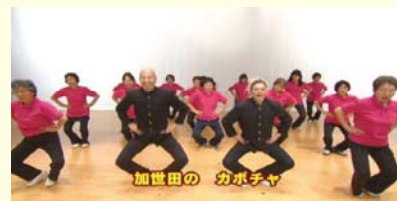
“健康体操YOKAなんなん”(南さつま市)