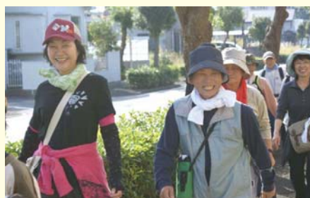
ウォーキング風景(枕崎市)

また、まちの中をたずねながら散歩できるように、枕崎市には、「南薩まち歩き枕崎」や「まくらざき食と健康体験マップ」、指宿市では、「山川港のまちあるき」、南さつま市では、「まち歩き散策マップ」、南九州市では、額娃町散策マップ「えい日和」などたくさんの散策マップがあります。