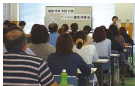
ゲートキーパー養成研修会の様子

加世田保健所(0993-53-8001 直通) 指宿保健所(0993-23-3854 直通)