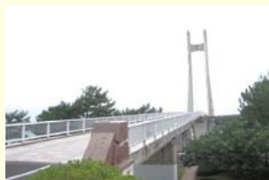
サイクリングコースのある サンセットブリッジ(南さつま市)