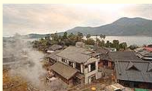
指宿地区唯一の単純硫黄温泉で、西郷隆盛が滞在したことで有名