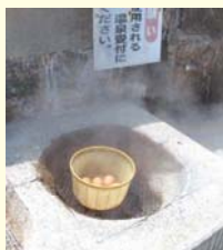
約5分で温泉卵のでき上がり