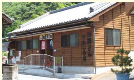
家の庭先に「スメ」と呼ばれる温泉の蒸気を利用した天然カマドが日常生活に使用されています。(区営鰻温泉では温泉卵も食べられます)