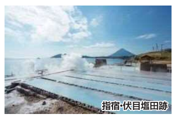
指宿・伏目塩田跡