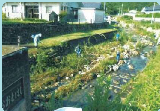
川の清掃活動の様子