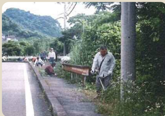
道路の清掃活動の様子