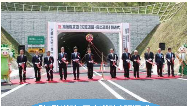
「知覧道路・霜出道路」開通式