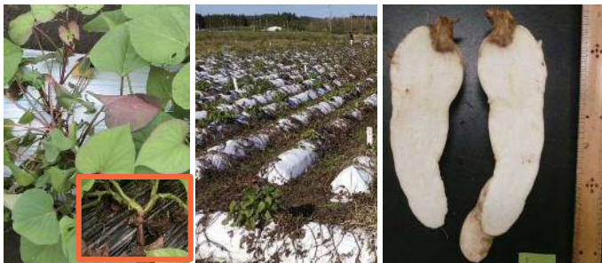
写真1 基腐病発生ほ場と感染したさつまいも