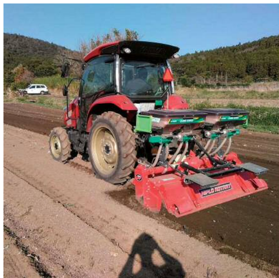
写真2 GPS車速連動型肥料散布機

GPS車速連動型肥料散布機により、施肥作業及び耕耘作業時間の47%削減を図ります。また、作業者の技術習熟度に関わらず、均一散布による生育ムラの解消を図ります。