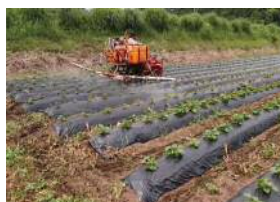
写真3 予防剤の散布