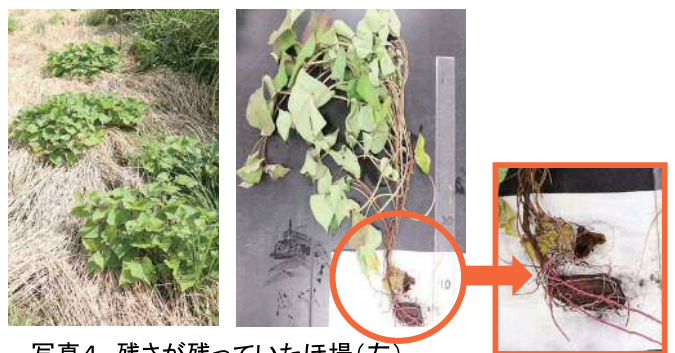
写真4 残さが残っていたほ場(左) 罹病いもから再発病した様子(右)

そのため、多発ほ場は、他品目を栽培するか、休耕し、厳寒期および夏場の耕うん、萌芽した株の抜きとり等、残さをなくす工夫をしましょう。