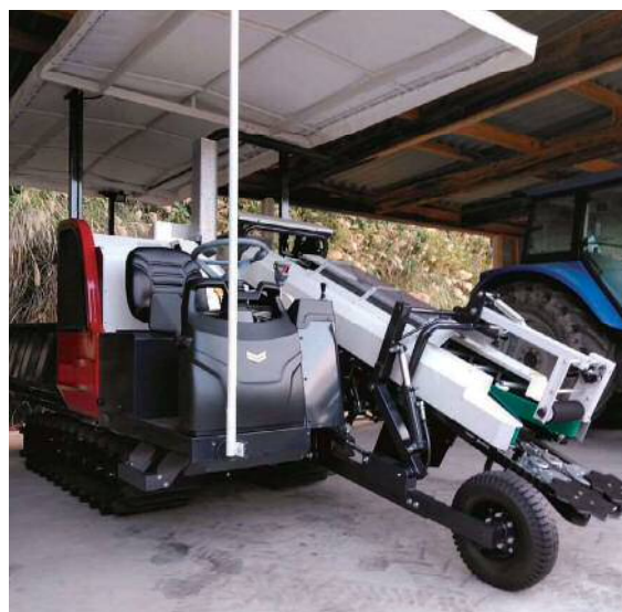
写真3 GPSロガー搭載キャベツ収穫機

GPSロガー搭載キャベツ収穫機導入により、収穫作業時間26%の削減を図ります。また、硬いキャベツを切って収穫するという重労働を減らし、軽労化を図ります。