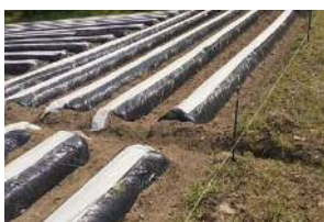
写真2 表面排水対策