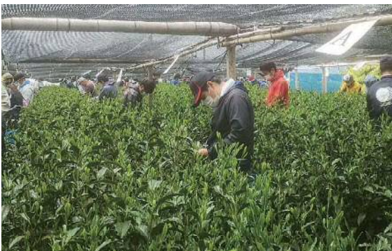
写真1 新型コロナ対策を講じた手摘み作業

普通煎茶4kgの部では、18年ぶりの手摘みにおよそ100名が参集されました。また、経験の浅い玉露・かぶせ茶・碾茶では、知識を結集して被覆や製造技術を工夫しました。