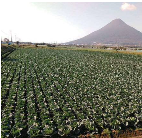
写真1 実証ほの状況

また、指宿市ではGPS車速連動型肥料散布機及びキャベツ収穫機の普及が進んでいないため、農業者や関係機関の指導員を対象に研修会、農業高校生に対して実証を行うことでスマート農業を広く理解できる人材育成に取り組んでいます。