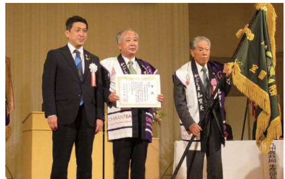
写真2 南九州市が塩田知事(左)より表彰