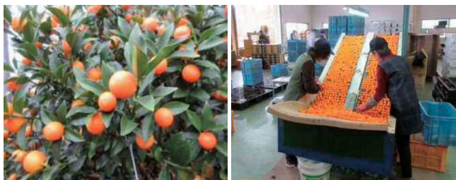
写真 完熟したハウスきんかん(左)、選果作業(右)

南薩地域のきんかん(ハウス・露地)の出荷は、11月27日から始まり、年明けから完熟の「きんかん春姫®(はるひめ)」の集荷・販売も始まりました。