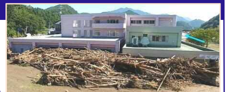
平成28年台風10号により、岩手県の要配慮者利用施設では利用者9名の全員が死亡。