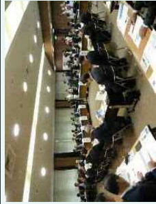
協議会の開催状況