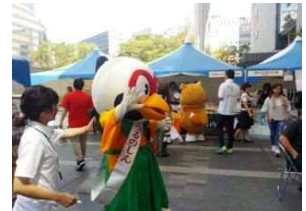
北薩摩観光物産展