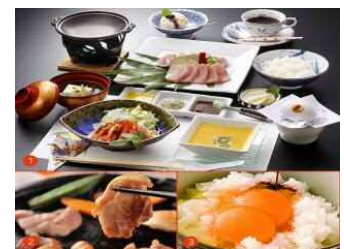
いずみ親子ステーキごはん

また、近年では、地域の食材を生かしたメニューである出水市の「いずみ親子ステーキごはん」、阿久根市の「うに丼」、薩摩川内市の「せごどんぶい」、さつま町の「黒毛和牛たけのこ丼」、長島町の「鰯王定食」といったご当地グルメも出現し、観光客から好評を得ています。