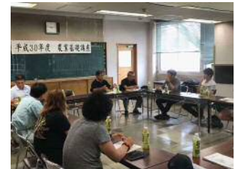
新規就農者研修会