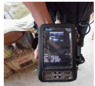
超音波画像装置を用いた繁殖牛の管理