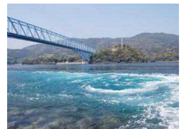
黒之瀬戸海峡の渦潮

特産品は、温州みかんやかごしまブランド品目の紅甘夏、ぼんたん、大将季、不知火など柑橘類、かごしまブランド品目の実えんどう、アジ・サバなど回遊性の魚などがあり、「アクネ うまいネ 自然だネ」を統一ブランドマークとして販売促進を図っています。