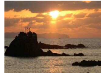
牛之浜海岸の夕日

北薩地域は、東シナ海に面し、黒潮の影響を受け温暖で恵み豊かな海域環境を有しており、川内川からの供給土砂により形成された川内平野、黒之瀬戸を挟み岩礁海岸の続く阿久根・長島、長目の浜や急峻な海岸の続く甑島など、自然豊かで風光明媚な海岸線を呈しており、国定公園や県立公園に指定されています。