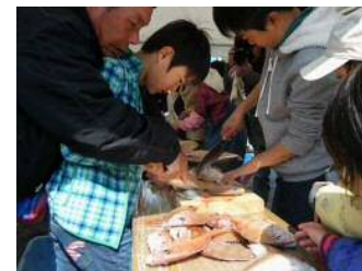
グリーン・ツーリズム