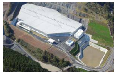
エコパークかごしま

北薩地域は、九州電力(株)川内原子力発電所等を有しており、本県のエネルギー供給基地としての役割を担っています。また、鶴田ダムを利用した水力発電所、長島町の九州最多規模の風力発電所、鶏糞や木質を利用したバイオマス発電所、太陽光発電所の整備など、再生可能エネルギーの導入も進んでいます。また、県内で唯一、公共関与による産業廃棄物管理型最終処分場「エコパークかごしま」が立地しており、これらエネルギー供給、循環型社会の先進地として、再生可能エネルギーに関連する雇用の拡大や、多様なエネルギーを活用したまちづくりが行われています。