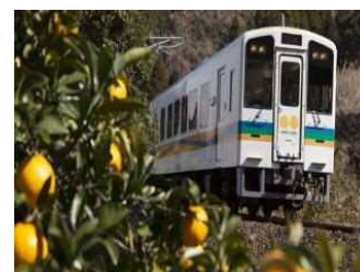
肥薩おれんじ鉄道

■肥薩おれんじ鉄道については、事業者、沿線自治体、北薩摩振興推進協議会、熊本県などと連携し、ウォーキングイベントや沿線マップの作成など、利用者の増加につながる取組を行い、維持・存続を図ります。