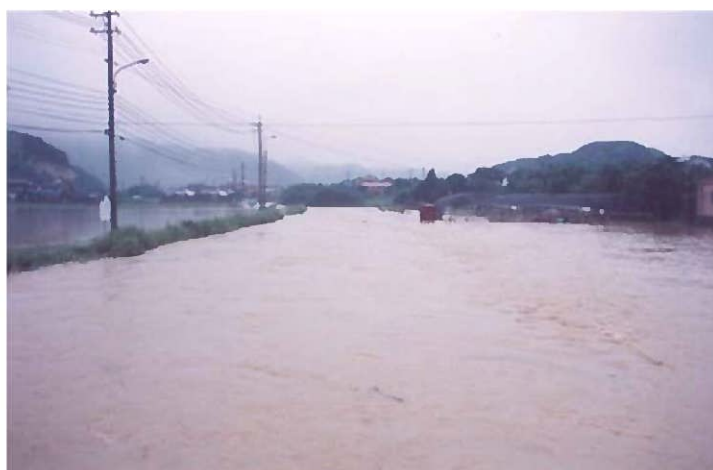
平成2年7月洪水 佐志川