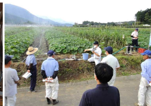
写真2 散水器具の実演会