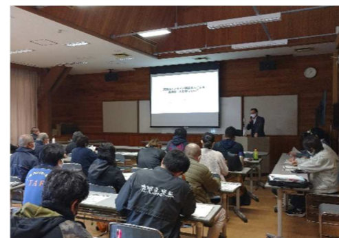
写真1 消費税に係るインボイス制度の研修会