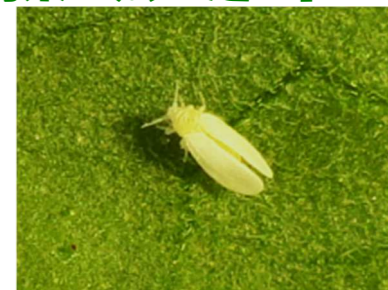
写真1 タバココナジラミ