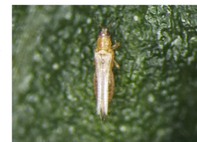
写真2 ミカンキイロアザミウマ