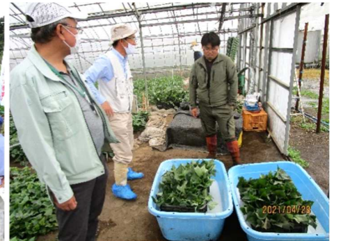
写真3 さつまいも育苗巡回指導