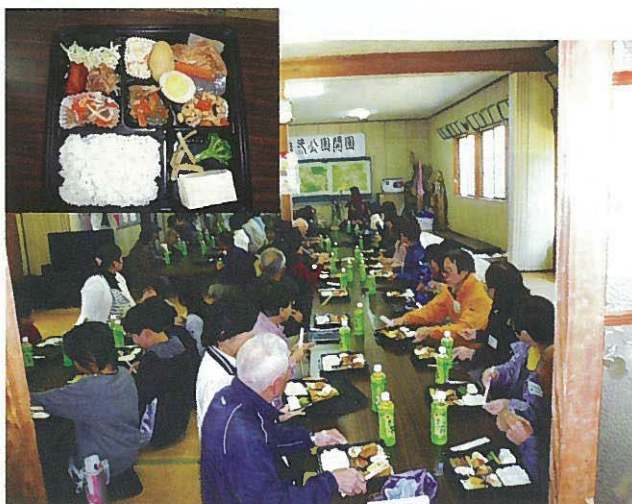
昼食風景とお弁当