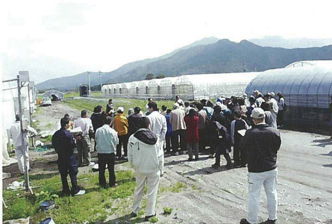
ハウスの前での説明風景

肝付町新富地区で、カラーピーマンを栽培しているJA県経済連トレーニングセンター第1期生のハウスを巡り、新規就農で一生懸命がんばっている姿をみてもらいました。