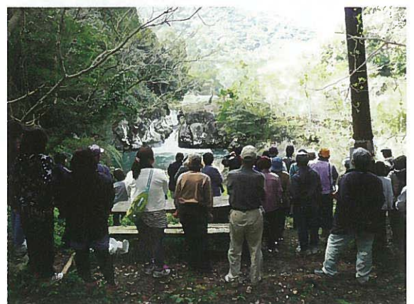
<右2枚> やまびこ館と川上地区の遊歩道の途中にある片野の滝