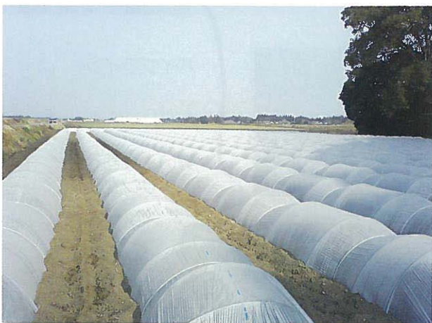
【第二高山地区施工後営農状況写真】

平成 23 年度は昨年度までに区画整理工事を終えた第二高山地区（肝付町新富）36.3ha の区画確定測量を実施しています。当該地区については、平成 25 年度までに換地処分登記を行い、事業完了する予定です。