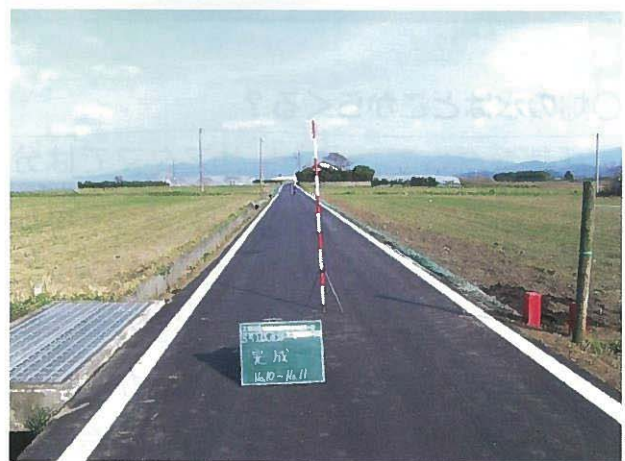
【8号支線農道完成写真】

鹿屋市下堀にあるモデル実証団地を中心とした地域（横山、下堀、田淵）において、平成 22 年度までに農道 992m、排水路工 629m を実施しました。また、平成 23 年度に当地域の畑地かんがい実施設計を終え、平成 24 年度から畑地かんがい施設整備を進めることとしています。