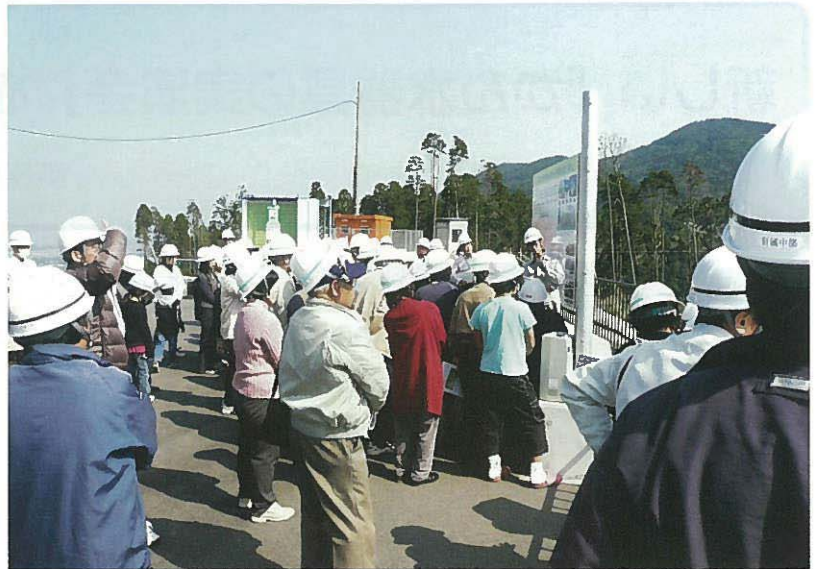
荒瀬ダム建設現場にて事業の説明を受けている風景