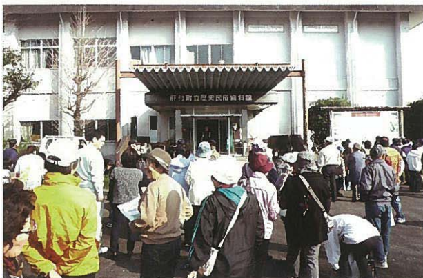
肝付町歴史民俗資料館前で 地元の方も知らないことがいっぱいでした