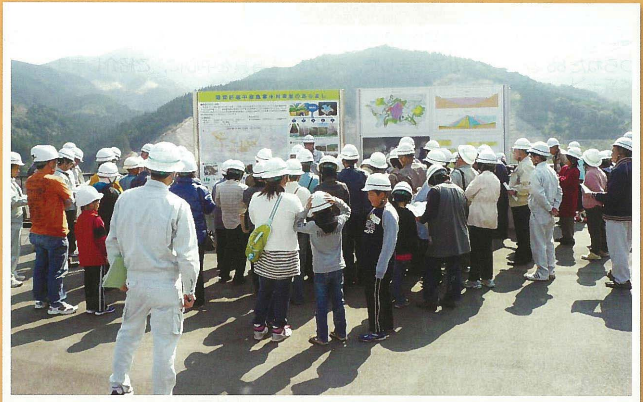
「ふるさとの歴史と肝属地域の未来を探るバスツアー」での荒瀬ダム見学風景

【編集事務局】 肝属中部地域 畑かんがい営農推進本部 (県大隅地域振興局農政普及課内) 〒893-0011 鹿屋市打馬2丁目16-6 TEL: 0994-52-2138 FAX: 0994-52-2147