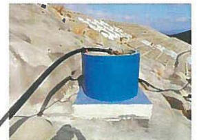
ダムに現れた ミニファームポンド

「荒瀬ダムでしょ！」とアタマでは分かっているのですが、規模が大きくてなかなかイメージが…ということで、荒瀬ダムの左岸に「ミニファームポンド」と「スプリンクラー」から構成される畑かん紹介コーナーを新設しました。現場見学会でも人気を博しております。