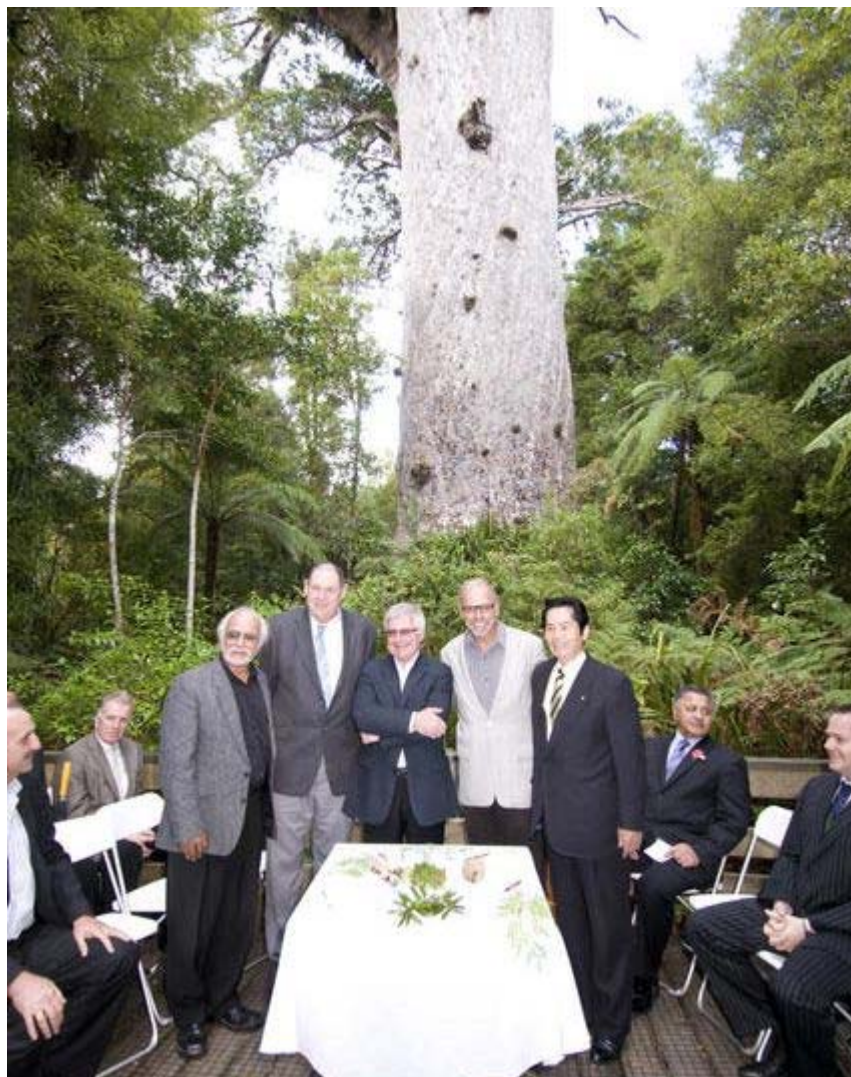
屋久島の「縄文杉」とニュージーランドの古木「タネ・マフタ」と姉妹木締結 (平成21年4月23日:ニュージーランド・ノースランド地方ワイポウアの森)