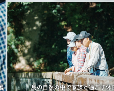
島の自然の中で家族と過ごす休日