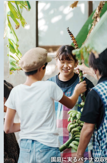
園庭に実るバナナの収穫