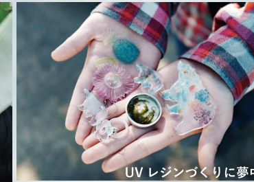
UVレジンづくりに夢中