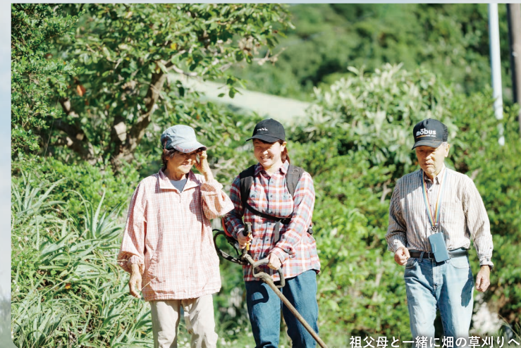
祖父母と一緒に畑の草刈りへ