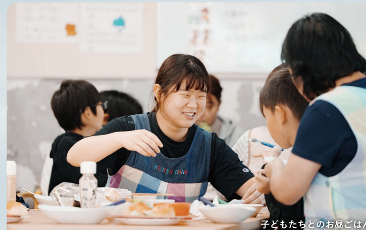
子どもたちのお昼ごはん