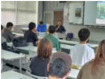
令和7年5月30日（金） 鹿児島国際大学 社会福祉学部3，4年生（44人）