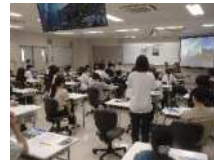
令和7年7月23日（水） 鹿児島医療技術専門学校 看護・介護福祉学科2年生（43人）