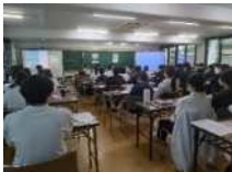
令和7年7月22日（火） 鹿児島医療福祉専門学校 看護学科2年生（52人）