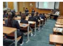
令和7年7月23日（水） 鹿児島医療福祉専門学校 介護福祉学科1，2年生（24人）