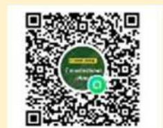
種子島スマート農業ネットワーク

上記研修会の情報等も随時発信しますので、スマート農業に興味のある方はぜひ、右のQRコードを読み取ってご参加ください。 ※無料、匿名で加入できます。