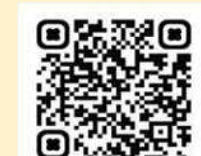
マンガでわかる熱中症予防