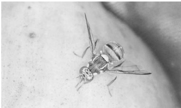
(ア) ミカンコミバエ