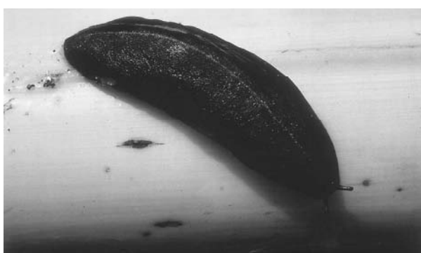
(ク) アシヒダナメクジ