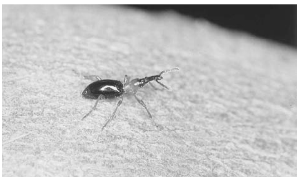
(ウ) アリモドキゾウムシ