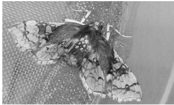
(オ) サツマイモノメイガ