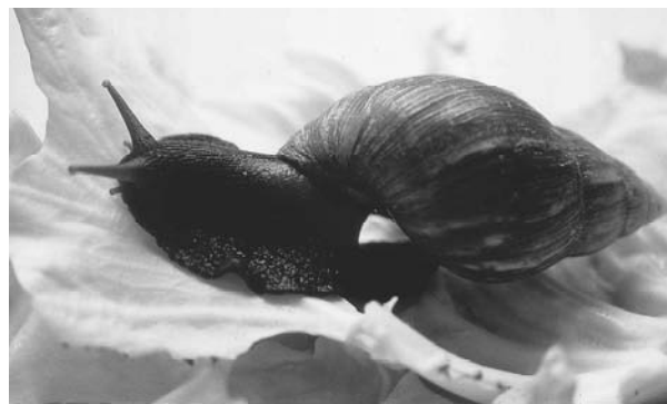
(カ) アフリカマイマイ