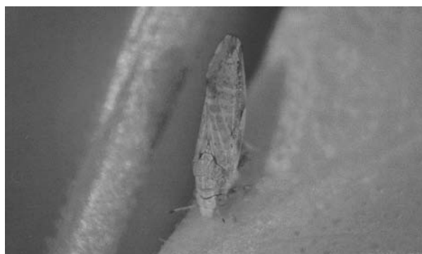
(キ) ミカンキジラミ (カンキツグリーンング病媒介虫)