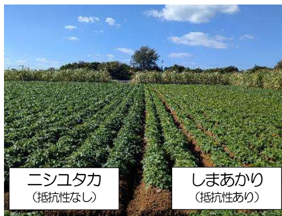
植付 53 日後の様子 (伊仙町)