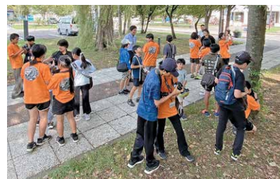
写真文化体験の様子

8月19日（火）に出発し、東川町の小学生写真少年団の子供たちから写真の撮り方を教わったり、日本語学校の留学生と交流したりして充実した日々を過ごしました。来年度は東川町から大崎町に迎え入れて交流します。