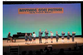
「Anything Goes! フェスティバル」 ～なんでん やってみっが! 見け行っが!～

子供たちが、日頃から練習している特技や趣味、伝統芸能などを披露・発表・交流する場を設定し、自己有用感を高める取組を行っています。子供たちや地域・保護者から募集した大切な人に伝えたい思いや言葉をつづった「志の言の葉」の作成や、毎月15日の「子ほめの日」、11月5日の「いい子の日」の啓発、全小・中学校の保護者に「志アップ子育て手帳」を配布し活用することで、学校・家庭・地域の連携や家庭教育向上に努めています。