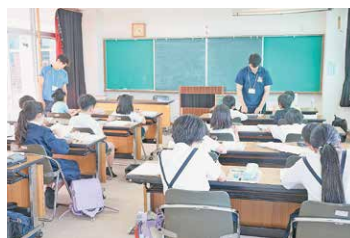
公営塾【小学生の学習の様子】

令和7年5月から町内の小学3年生から6年生、及び中学3年生を対象に東串良町公営塾を行っています（中学3年生は9月から開始）。小学生に対しては、算数・国語・英語のワーク教材を使い、中学3年生に対しては、学習者が持参した教材・問題集を使いながら、自主学習の定着に向けた取組を行っています。