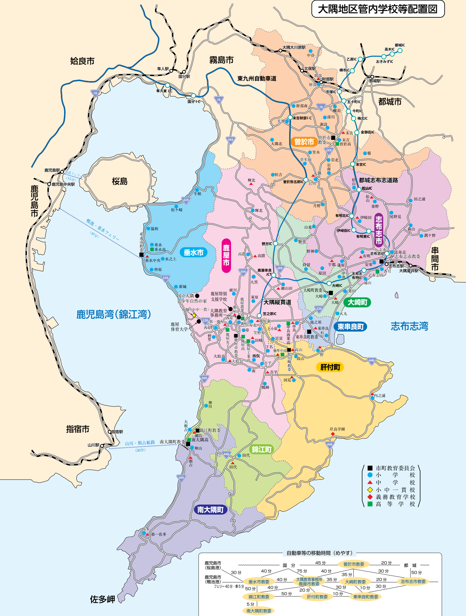
大隅地区管内学校等配置図