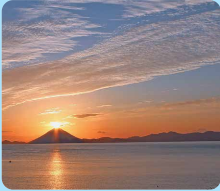
南大隅町：ゴールドビーチ大浜海水浴場