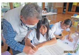
【寺子屋野里塾ウイズ・ユー】

地域の公民館等を活用して、子供たちが学習活動や地域の人々との交流を通して学び合う楽しさと郷土愛を育むことを目的として取り組んでいます。平成28年度からスタートし、現在、約400人の子供たちが塾生として参加しています。子供たちは、地域の方々と学習活動や体験活動を通して学び合う楽しさや郷土愛を育み、異年齢交流を通して地域の絆を深めています。今後も地域の希望である子供たちを地域で育んでいきます。