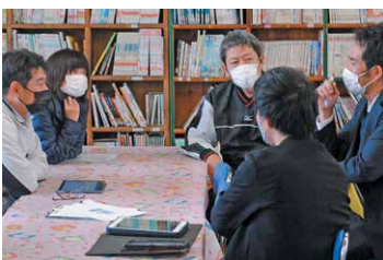
学校教育【小中一貫教育協議会】

2小1中の強みを生かすため、年2回、町内の教職員が一堂に会し、授業参観や分科会を行い、9か年で系統的な学習指導や生徒指導を実現できるように研究・協議を行っています。（令和7年度は「学習者主体の授業」実現プロジェクト実践校区として、授業研究会を通じた研修（9/17、12/4）を実施します。）