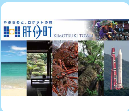
肝付町：やぶさめと、ロケットの町