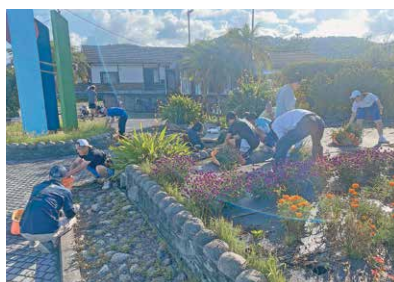
佐多駐在所前の花壇除草作業

毎月第3土曜日を「南端まちづくり活動」の日とし、地域住民や青少年と一緒に美化活動を行っています。まちをきれいにするとともに、青少年の健全育成を図ることを目的に、花壇の花の植え付けや除草作業、公園の清掃活動をしています。