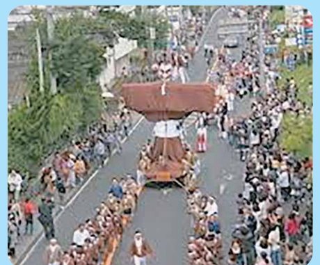
曾於市：弥五郎どん祭り