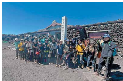
トワイライト研修（富士登山）

青少年教育の充実、振興の一環として、小中学生を対象に、「トワイライト研修」や「夏休み子供体験教室（生涯学習講座）」などを行っています。異年齢による学習活動・自然体験や、県内外での宿泊を伴った体験活動を通して、地域で活躍する子供の育成を目指しています。