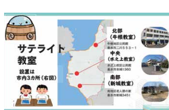
「サテライト教室」の案内

登校が難しい児童生徒に学習支援等を行い、社会的自立をサポートするために、垂水中央中学校にある校内教育支援センターの「サテライト教室」を市内3箇所に開設しました。一人一人の学びの場を保障し、心に寄り添う支援を行います。