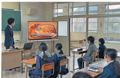
中学校教員による小学生への算数の授業

2つの中学校区ごとに施設分離型小中一貫教育に取り組んでいます。「義務教育9年間の教育」を見据え、学力向上や生徒指導の充実を図り、児童生徒の交流学习や教職員の相互研修などに取り組んでいます。また、地域学校協働活動や学校運営協議会なども取り入れ、地域と一体となって子供たちを育む教育に取り組んでいます。