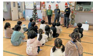
【田崎町川西町子ども会】

「地域の子供は地域で育てる」の理念のもと、子ども会加入率100%（小学生）を目指した「S-KOKA (Super-Kanoya Original Kodomokai Association) プロジェクト」に取り組んでいます。大切にしていることは、「育成会は見守りに徹し、子供たち自身で話し合い、考え、実行すること」です。高学年の子供たち（リーダー）を中心に、地域の公民館や学校の空き教室を使って話し合い、イベントの準備や進行、片付けまで子供たちでやり遂げる子ども会活動の普及に努めています。