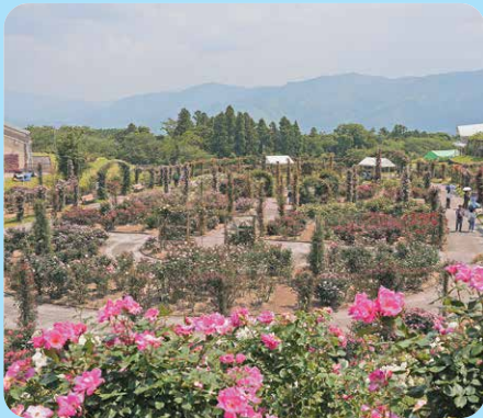
鹿屋市：かのやばら園