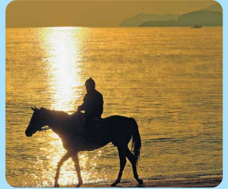
大崎町：横瀬海岸（競走馬の調教）