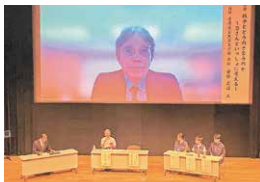
【戦争体験者を交えたトークセッション】

世界平和を願う児童生徒の平和へのメッセージを鹿屋から発信し、平和や人権について考える機会を提供する趣旨のもと、かのや未来創造プログラム「平和の花束」事業に取り組んでいます。今年度は、県内外の小・中・高校生及び台湾から4千点を超える平和へのメッセージの応募がありました。8月8日のセミナーでは、受賞者の表彰及び朗読、講演会等を行いました。今後も、ラジオ放送、記念誌等を通して平和へのメッセージを紹介していきます。