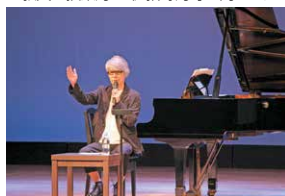
志アップ教育講演会 (サマープロジェクト)

教員の授業力・生徒指導力等の向上のために、スプリング、フレッシュ、サマーと3回の「志アッププロジェクト」を行っています。スプリングプロジェクトでは道徳、生徒指導、人権教育の視点から、サマープロジェクトでは、午前は教科領域等の講座、午後は教育、スポーツ、文化面で活躍されている方を講師に招き、教育講演会を開催しています。また、市内全21校が自主的研究推進校となり、連携協定を結んでいる鹿児島大学や鹿児島体育大学等から、アドバイザーを派遣して研究を深めるなど、研修等の充実を図っています。