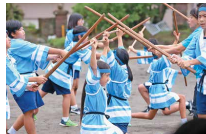
田代地区の伝統芸能「上柴立棒踊り」

「森と水の俳句・写真コンクール」や「ふるさと錦江検定」、「畜産を学ぶ会」などを通して、郷土のよさに触れられるようにしています。また、郷土の人材を活用して、産業、伝統芸能の継承など郷土のよさを地域ぐるみで伝えていけるようにしています。