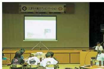
交流事業【郷土についてのプレゼン発表会】

自治体間連携協定を結び島根県江津市の児童生徒を迎え、コミュニケーション能力の伸長やプレゼンテーション技術の獲得を目的に交流事業を実施しました。参加した児童生徒は交流を通して、江津市のよさを知ることができたとともに、東串良町の魅力を再発見する機会となりました。