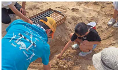
肝付町の学校で育む、未来への力

豊かな自然と宇宙の町、肝付町。この地では、子供たちが学校ごとの特色ある体験活動を通して、未来を生き抜く力を育んでいます。