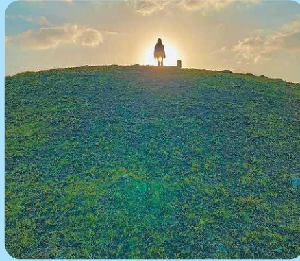
東串良町：唐仁古墳