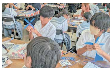
志学教室 (夢プロジェクト「STEAM 教育」)

土曜学習教室「志学教室」（中学生対象）、夏休み学習教室（小学3年生～6年生対象）等を実施するとともに、自分の理解度に応じて取り組めるアプリケーションの導入や、中学生英語技能検定助成事業、鹿大学生による学習指導サポート事業、学びの多様化教室「松風」等により児童生徒の学び意欲を高め、学力向上を目指しています。