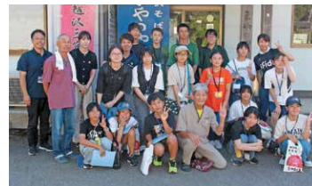
【鶴岡市における産業体験】

友好都市である鶴岡市を訪問し、青少年同士の交流を行ったり、歴史や文化、自然、産業など多彩な体験を通じて、地域の魅力を学び合ったりする交流事業です。未来を担う世代が視野を広げ、地域同士の絆を深める友好都市ならではの魅力あふれる研修です。