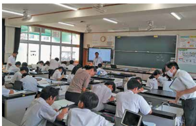
学習に取り組む中学生

指導者には、学校職員、地元の高校生ボランティア等の協力もいただき実施することができました。