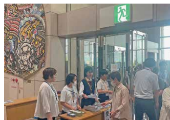
イベントでの受付

小学生から高校生まで、合計15人が所属しています。様々な活動や多くの方との交流を通して、郷土愛や自主性を育むことが目的です。今年度も、イベントでの受付や案内、ボランティア活動等に取り組み、多くの方と親睦を深めています。