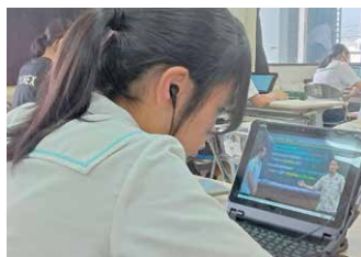
「講義動画」を視聴しながらの学習

年間15回、土曜日の午後中学生の希望者を対象とした学習会を実施しています。今年度は、自分の端末を使って、民間企業が提供する「講義動画」を視聴しながら学ぶ機会も設けました。自分の夢に向かう子供たちを応援します。