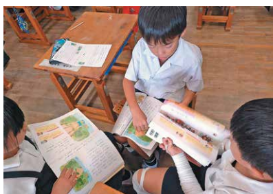
地区道徳教育研修会（神山小）

町内全小中学校が連携して、「個別最適な学びと協働的な学びの一体的な充実」に取り組んでいます。各学校での研究の充実はもちろん、県・地区の研究指定を受けるなどして研究を深め、教員一人一人の授業力や子供たちの意欲の向上を図り、学習者主体の授業づくりを推進しています。