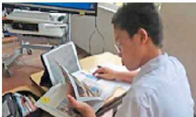
AIドリルで変わる学びのカタチ

肝付町では、子供たちが自ら学びを創り、未来を切り拓く力を育むため、「学びの個別化、個性化、協働化」を推進しています。その中心となるのが、AIドリルを活用した「学びのDX」です。