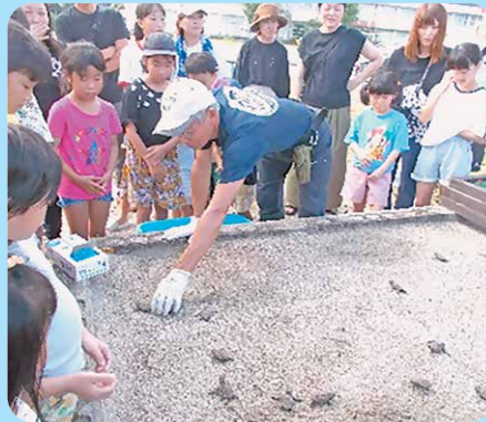
志布志市：ウミガメの放流