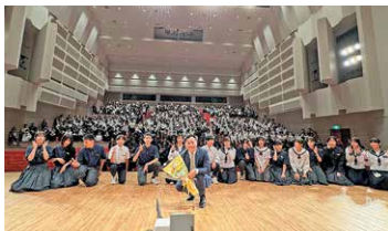
【郷土の先輩による講演会】

生徒たちが自分自身の可能性を信じ、夢や希望を育むこと、そして市内3校の中学生が交流を深め、郷土や学校への愛着を育てることを目的として「曾於市3中フェスティバル『Soo Good Fes』」を開催しています。