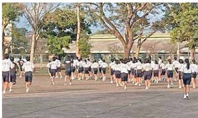
努力が伝統を創り、誇りが未来を拓く