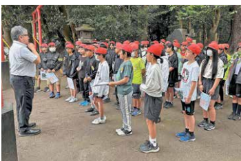
文化財【唐仁古墳群1号墳説明会】

本町は国指定の「唐仁古墳群」をはじめ、多くの文化財を有しています。児童生徒や教職員に多くの文化財に触れられる機会を設け、郷土教育の実践に生かしています。