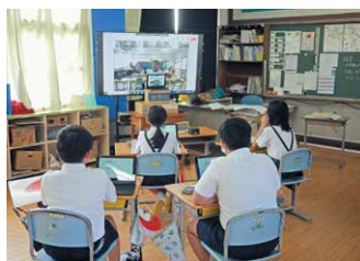
遠隔合同授業「まちの将来像意見交換会」

全小・中学校で、「情報活用科」を新設した研究が始まります。新教科で身に付けた情報活用能力を生かし、総合的な学習の時間「ふるさと垂水」で体験し、学んだことをまとめ、発信する学習により、子供たちの郷土愛を育みます。