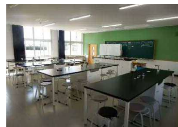
すっきりとした理科室