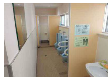
トイレの洋式化で明るく清潔に