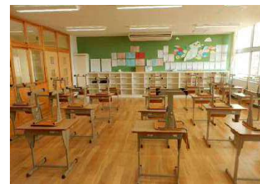
LED照明を導入した優しい教室