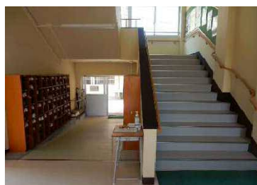
滑り止めを施し安全になった屋内階段