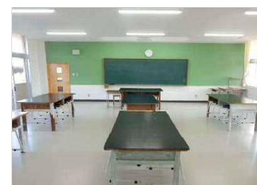
開放的な多目的室