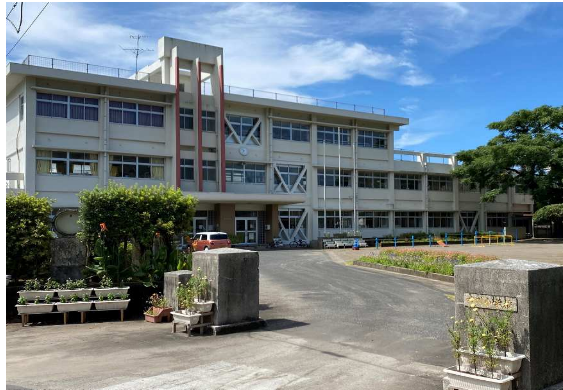
全 景 写 真