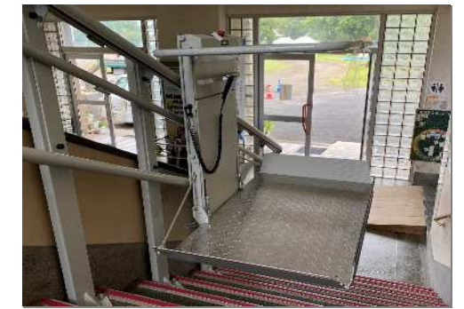
昇降機速度 (最大)6m/分