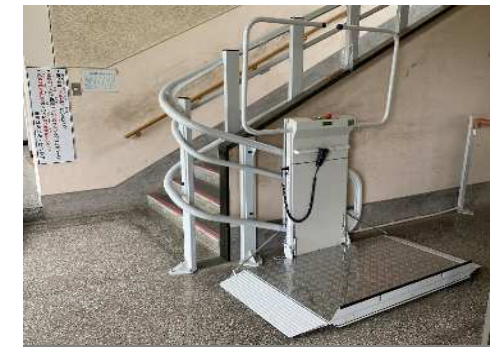
本校舎(1号機) 昇降行程:20.4m