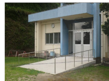
外から昇降ホールの段差へスロープと手すり設置