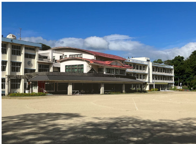
全 景 写 真