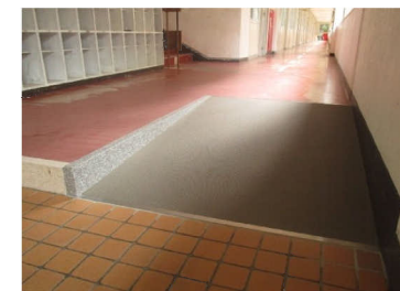
靴箱から昇降ホールの段差へスロープを設置