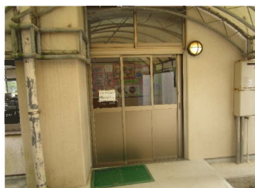
東側昇降ホールから保健室へ渡り廊下を設置