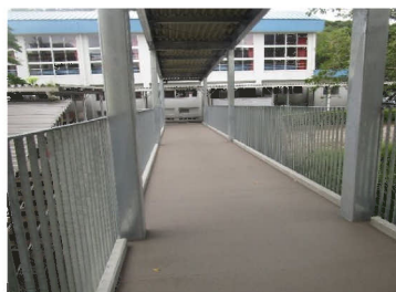
既存校舎から屋内運動場をつなぐ渡り廊下を新設