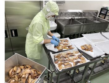
焼物揚物スペース2