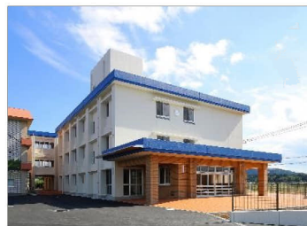
校舎(普通教室棟)増築 快適性と省エネルギーの両立