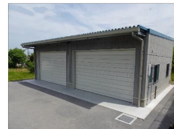
バス車庫 スクールバスの増台に対応