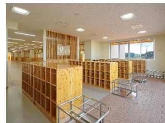
昇降口 学年ブロックごとに配置