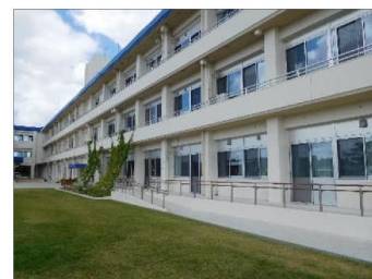
校舎(管理教室棟)改修 大規模改修