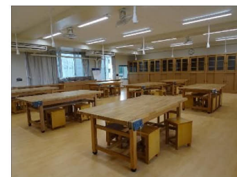
校舎(特別教室棟) 樹木を活用し作業台を製作