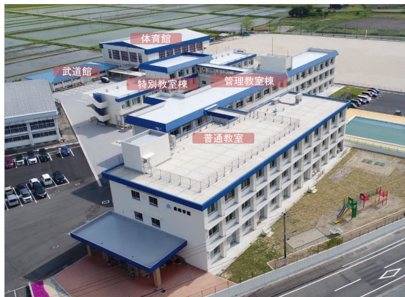
全 景 写 真