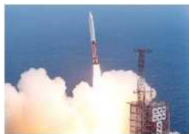
【「はやぶさ」を搭載 とうさい したロケットの打ち上げ】

第一に、新しいエンジンです。空気のない宇宙では、酸素 さんそ がなくとも動くエンジンが必要です。しかも、何年間も動き続ける つづ ことが