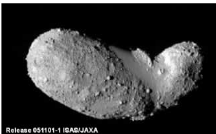
【小惑星イトカワ】 （「はやぶさ」撮影）

ようやくイトカワに到着した「はやぶさ」は、一回目の着陸を試みしました。しかし、着陸直前にバランスを崩し、機体の一部をイト