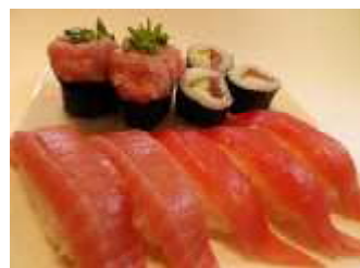
【マグロの寿司 すし 】