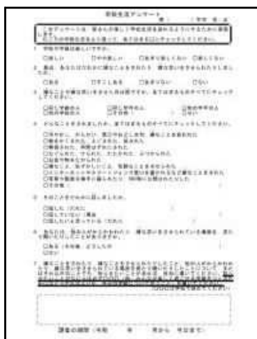
学校生活アンケート