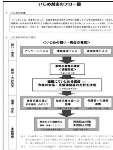
いじめ対応のフロー図