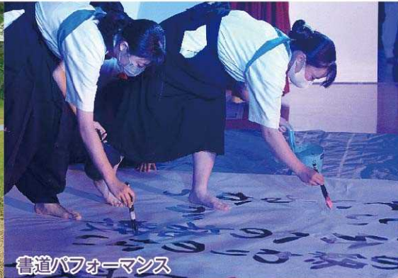
書道パフォーマンス