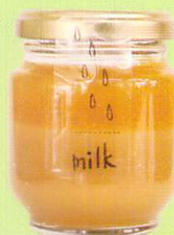
オレンジミルクジャム