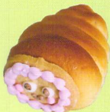
わらびなちゃんコロネ