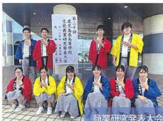
商業研究発表大会