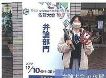
弁論大会 in 佐賀