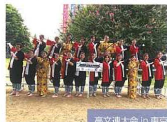
高文連大会 in 東京