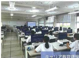
キャリア教育講座