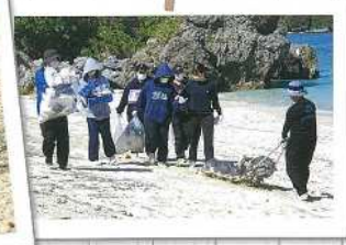
海岸清掃ボランティア