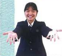
商業科では、ビジネス系の資格をたくさん取得することができます。検定前になると友達と教えあい受かったときはすごく嬉しい気持ちになります。1クラスしかないので3年間で友達と本当に仲良くできるので、毎日がとても楽しくなります。沖高で楽しい生活を一緒に送りましょう。