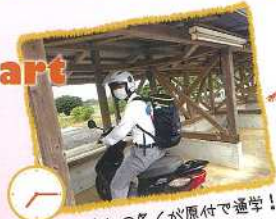
登校 沖高生の多くが原付で通学!