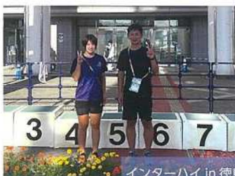
インターハイ in 徳島