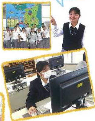
商業科の課題研究では、自分が決めたテーマを探求することができます!