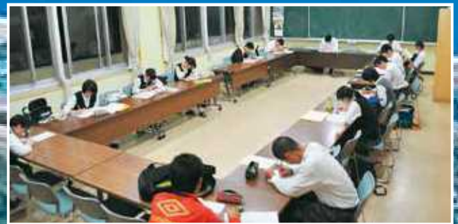
早朝・放課後や休日等は、会議室で自習をすることができます。