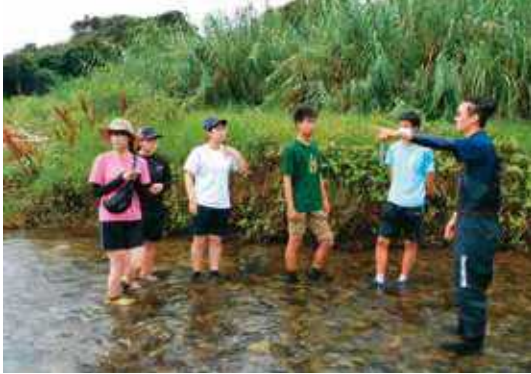
イテゴ川生物調査