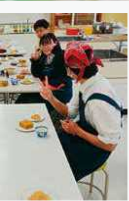
コース郷土料理実習 立大学個別試験 進学合格体験発表会