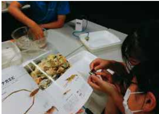
イテゴ川生物同定調査