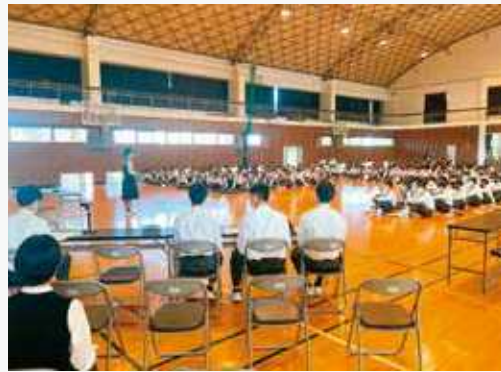
5月 生徒総会 PTA総会