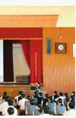
ガイダンス 入学共通テスト出願