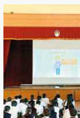
10月 職業 大学