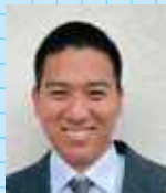
九州大学 理学部 物理学科