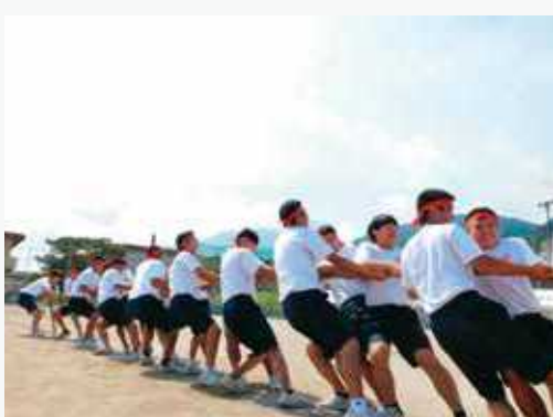
9月 体育祭 秋季地区大会 就職結団式