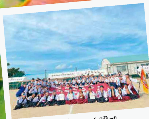
応援団の活躍で 体育祭は大盛り上がり！ 学年の意地を見せます。