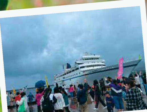
春は出会いと別れの季節。先生の見送りや出迎えには多くの生徒が駆けつけます。