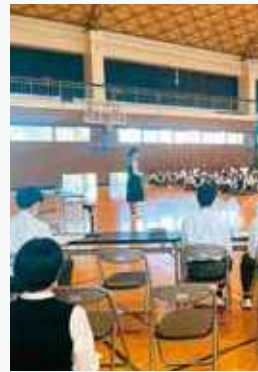
6月 文化 進路 生徒