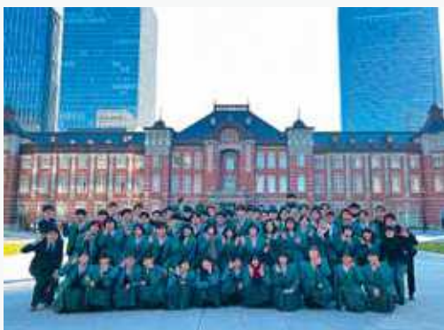
12月 修学旅行(2年) クラスマッチ 黒潮キャンパス中間発表(2年)