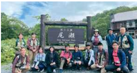
全国高校生自然環境サミット(群馬県尾瀬国立公園)

課題研究の内容を外部の学会や研究発表会などでも発表し,表現力やコミュニケーション能力を高めています。