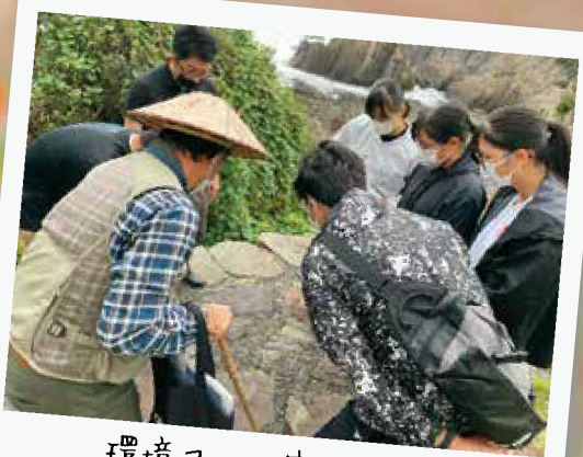
環境コース宿泊研修 地学・生物・公民(年3回実施) 野外活動実習もあります。