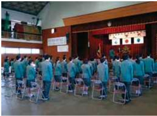
4月 始業式・入学式 新入生オリエンテーション 春季地区大会