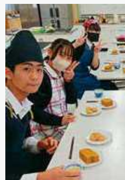
2月 環境 国公 就職