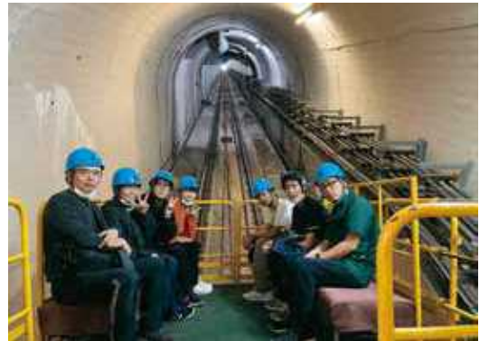
安房川第二発電所施設見学