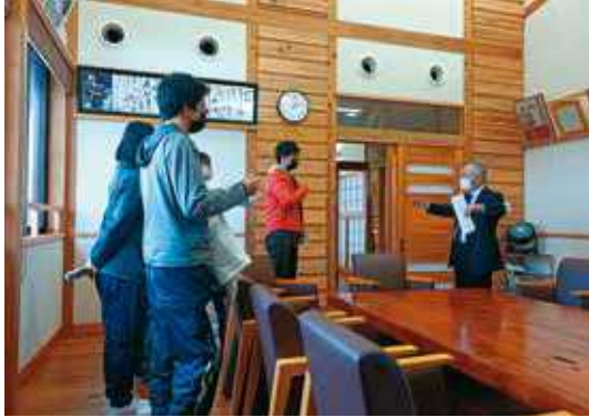
屋久島町役場見学