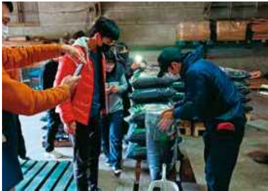
屋久島地力センター見学