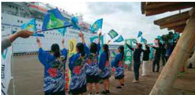
↑ クルーズ船おもてなしは情報ビジネス科伝統の活動です。