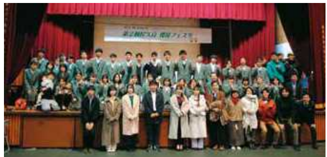
↑「屋久島発! 屋久島お助け隊」を結成して、地域を盛り上げています。