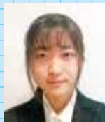
熊本大学 文学部 歴史学科

屋久島高校は他の高校よりも少人数なので生徒一人一人に先生の目が届きやすく、自分のペースに合わせた学習ができると思います。また、屋久島高校は部活動やボランティア活動も盛んなので、勉強が苦手な人にも活躍の場があります。さらに、屋久島高校では自然に囲まれた環境で学習することが出来ます。屋久島に住んでいると気づきにくいですが、屋久島の自然は素晴らしいものです。ぜひ、屋久島高校に進学し、屋久島の大自然のなかで勉強や部活動に取り組んでください。