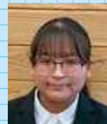
屋久島町役場 公務員

屋久島高校は生徒数が少数であるために、先生方が個々の能力や内面をよく理解し、生徒の能力を伸ばすための手助けをしてくれます。個別指導や質問も快く受け入れてもらえ、放課後や朝にも自習をしている生徒が多くいるため、学習に適した環境が整っています。進路についても生徒一人ひとりの目標に合わせた指導を受けることができ、安心して進路実現のための対策ができるでしょう。また、部活動やボランティア活動、探究活動も盛んなためにそれぞれが得意な分野で活躍することができます。『離島だから』というような不利な点は感じられず、むしろ屋久島高校だから挑戦できることが沢山あります。ぜひ自分のやりたいことに挑んでみてください。