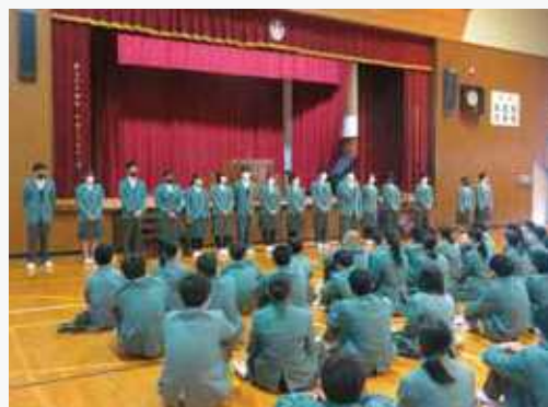
1月 大学入学共通テスト 情報ビジネス科課題研究報告会 地区高校総合文化祭