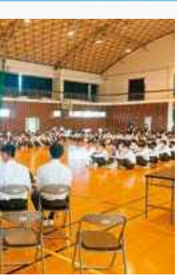
祭(2日間開催) ガイダンス 会役員改選