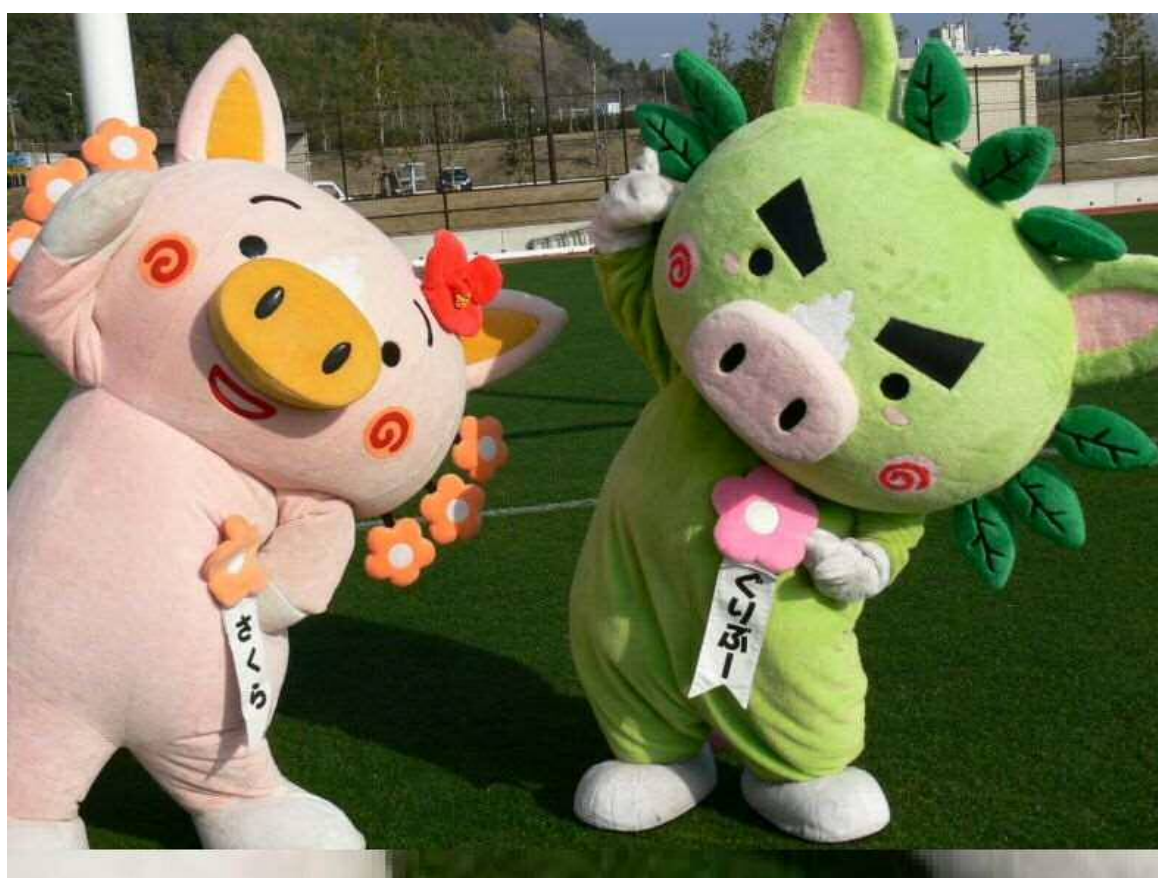
かごしまPRキャラクターぐりぶー・さくら