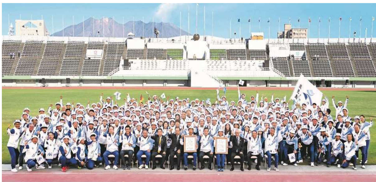
【かごしま国体 解団式後】