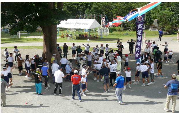
【八月踊りの最後は六調】