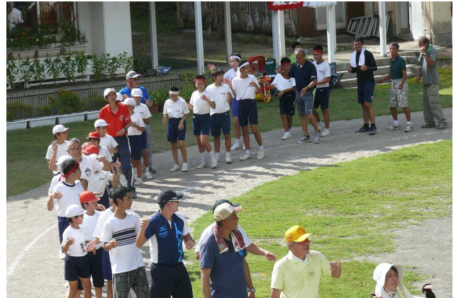
【運動会 円には様々な方々が】