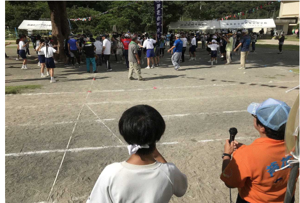
【六調の歌は中学生が歌いました。】