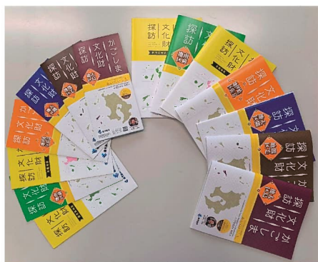
かごしま文化財探訪（冊子）

また、国・県の文化財に対する直接的な補助金以外でも、地域振興に係る交付金を一部活用して文化財の情報発信を行うガイドブックや動画等を制作する事例や、民間の団体による助成事業もあります。その他にも、ふるさと納税やクラウドファンディング等の枠組は、未指定の文化財の保存・継承活動等へも多様な主体から支援を受けられる手法であり、それらの制度についても積極的に周知を図り、活用を促していきます。