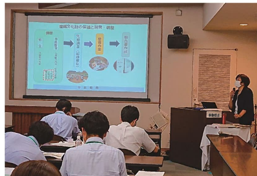
埋蔵文化財専門職員養成講座 (研修)

平成30(2018)年の保護法改正に伴う「文化財に係る専門的知見を有する人材の育成及び配置について、国及び地方公共団体がより積極的な取組を行うこと」という附帯決議を踏まえて、地域史研究を行う能力や