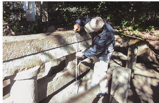
文化財保護指導委員による巡回

文化財の保存・継承に当たっては、所有者や伝承者、管理団体、行政だけでなく、より多くの方が地域の文化財に愛着を持ち、保存や活用のあり方について考え、地域全体で守り伝え、支え合う体制づくりが大切です。そのためには、多くの県民に文化財が持つ潜在的な力が地域づくりの大き