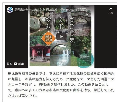
かごしま文化財探訪（動画）