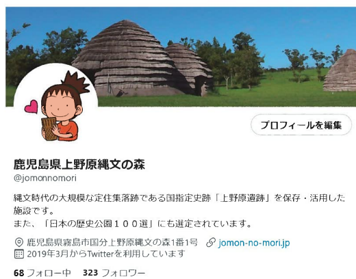
SNSによる情報発信 (上野原縄文の森)

各市町村や民間団体が設置する博物館等にも、多くの文化財が収蔵されています。最新の研究成果などによる文化財的な価値の再評価や、博物館間での収蔵資料や展示方法等の情報共有を行うことで、収蔵資料のさらなる活用にも繋げることができます。公開や情報の発信については、所有者や関係市町村の相談等に対応するとともに、情報提供・情報共有に努め、地域の魅力発信が図られるよう支援を行います。