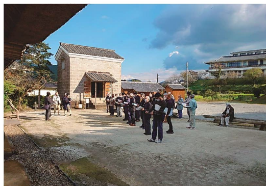
ヘリテージマネージャーの スキルアップ研修講座

文化財は、その種類や性質等に応じて適切な保存・活用を図る必要があります。研修による各文化財に対する理解と知識の向上や、専門家との情報共有・連携により、必要な対応が取れるよう支援していきます。