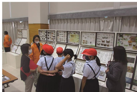
移動博物館での学芸員の標本解説 (県立博物館)