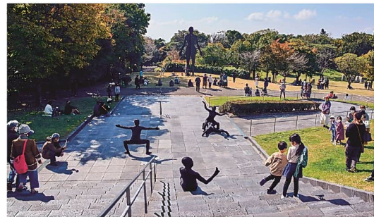
美術館を舞台とした創作ダンス (霧島アートの森)

県では、これらの取組に必要な国の補助金や活用事例等について積極的に情報収集を行うとともに、市町村の文化財部局だけでなく、観光・地域振興部局等への情報提