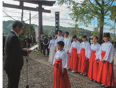
かごしま無形民俗文化財（民俗芸能） 伝承活動表彰 （令和2年度 入来神舞）

天然記念物については、鳥インフルエンザウイルスやロードキル（交通事故）の対策等、環境部局や農政部局等と情報を共有し、連携しながら保護に努めます。