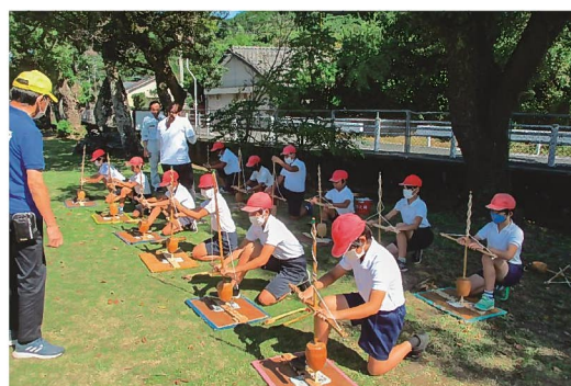
お出かけ体験隊 (上野原縄文の森)