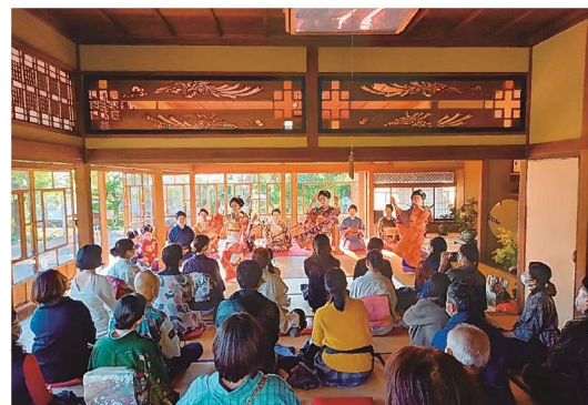
「旧田中家別邸」での座敷舞披露