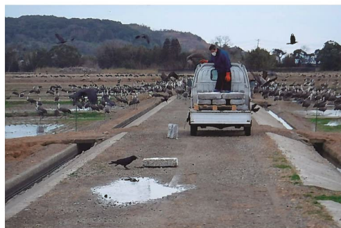
食害対策としての給餌事業 （鹿児島県のツルおよびその渡来地）

国・県では指定文化財等に対する調査、公開、管理、地域の資源としての活用、後継者育成等に関する補助金があります。例えば、有形文化財では管理のための防災設備の保守点検や解体修理等に対する補助金、天然記念物では給餌や樹勢回復等に対する補助金等、また、史跡では復元等の整備や調査、無形文化財や無形の民俗文化財では道具の修理や継承事業の支援等、多岐にわたる補助制度が設けられています。文化財の所有者や管理団体が目的に合った補助を受けられるよう、国の補助金については、各補助金の要綱を熟知し、適切に情報提供するとともに、県の補助金についてはニーズに合わせ、柔軟に補助内容の検討を行います。