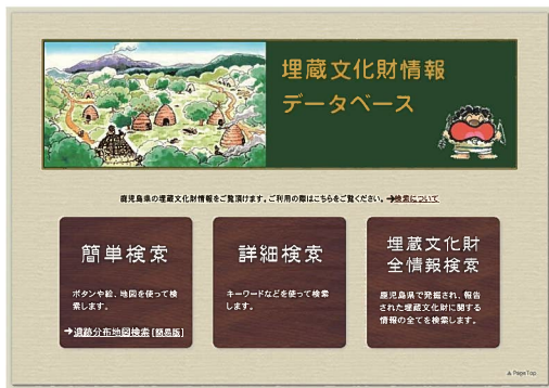
埋蔵文化財情報データベース (県立埋蔵文化財センター HP)

周知の埋蔵文化財包蔵地の開発には事前協議で保護と開発の調整が図られています。開発に伴い未周知の遺跡が破壊されるおそれもあります。開発の規模が小さくてもそれが遺跡の中心になる部分であれば、遺跡の価値は大きく損なわれることになり得ます。そのため、計画的かつ継続した埋蔵文化財の分布調査とその成果の周知、試掘・確認調査等による情報の蓄積が求められます。県では、埋蔵文化財情報管理システムによる遺跡GISや埋蔵文化財情報データベースの管理と、情報公開を行っています。