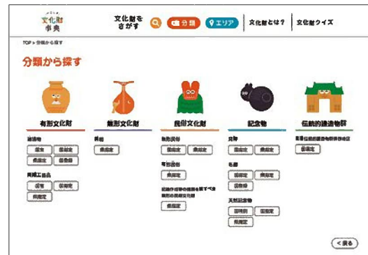
かごしま文化財事典の更新

県内の自然，歴史・伝統，民俗・文化，人物等地域の特性に根ざした文化財を学校教育や地域活動を通じて学ぶことは，後の世代へ確実に継承するために重要なことです。また，文化財を通して体験したり学んだりする活動を通して，生まれ育った郷土鹿児島への理解を深め，郷土への愛着や誇りを持てるように促すことも大切です。