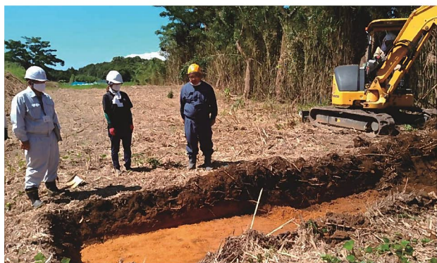
埋蔵文化財の試掘調査

文化財の調査に当たっては、県と各市町村が連携を図り、文化財保護審議会委員、埋蔵文化財専門職員、博物館等の学芸員による調査をはじめ、外部の専門機関や大学等への調査委託等による効率的で学術性の高い調査の実施等、調査・研究の方法・内容の充実を図ります。