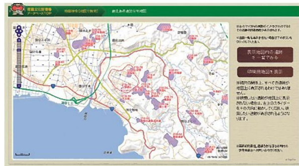
遺跡 GIS 公開 (県立埋蔵文化財センター HP)