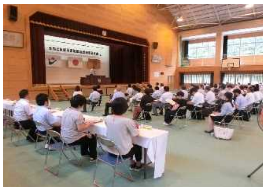
【上市来中小：全体会】