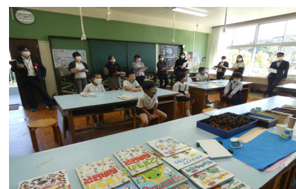
【研究授業（1年生）の様子】

また、当日は、1年生「生活科」と6年生「外国語科」の授業が公開されました。どちらの学級でも子どもたちが生き生きと学習に取り組み、2年間にわたる研究の成果を十分に発揮していました。