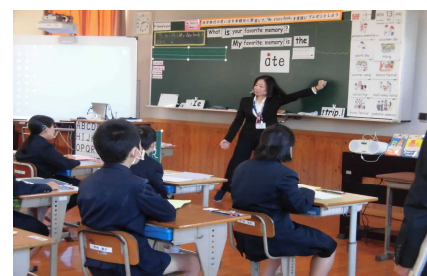
【外国語活動・外国語部会】