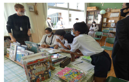
【研究授業（6年生）の様子】