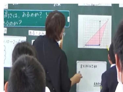
【算数・数学部会の様子】