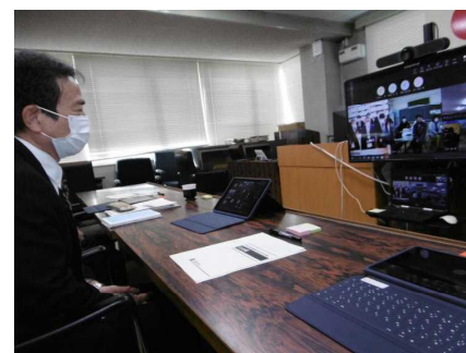
【開会行事の様子（三島硫黄島学園）】