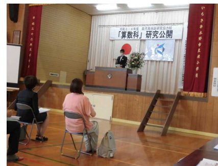
【開会行事の様子（旭小学校）】