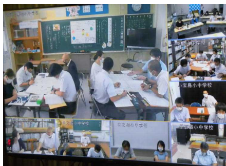
【研究協議の様子（諏訪瀬島小・中学校）】