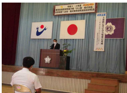
【開会行事の様子（上市来小学校）】