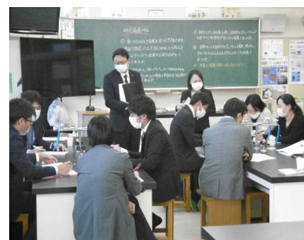
【外国語活動・外国語部会の様子】

3つの各部会で作成した資料や授業動画は、12月に地区内すべての小・中・義務教育学校にDVDにて配布しています。また、作成資料については、かごしま学力向上支援Webや本ホームページの「指導に役立つ資料」にも掲載してありますので、どうぞ御活用ください。