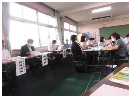
【研究協議の様子（市来中学校）】