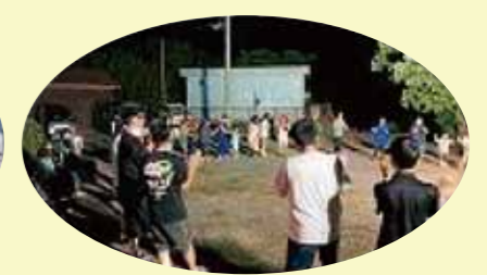
諏訪之瀬島の八月踊りと子供たち