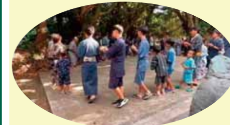
悪石島の盆踊りと子供たち