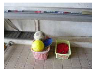
【ボール・フリスビー等】