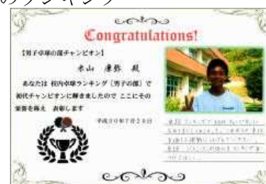
【スポーツランキング表彰状】