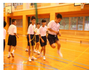
【8の字跳びの学年練習】