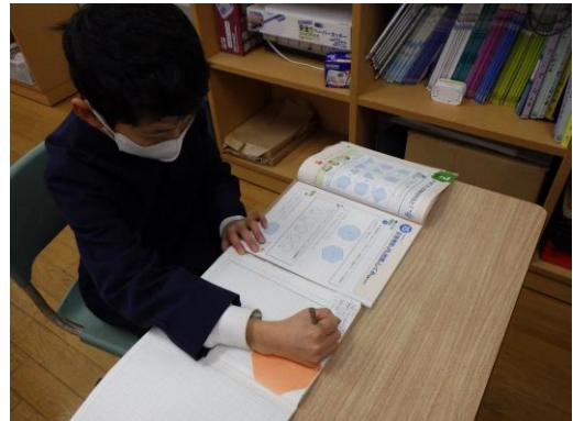
振り返りをしている児童の様子→