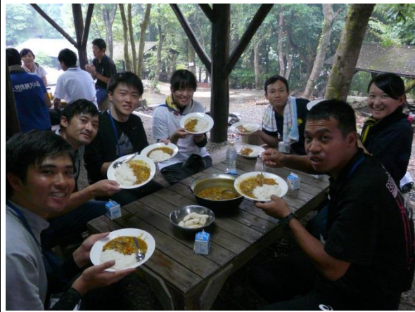
野外活動の講義と実際：野外炊飯