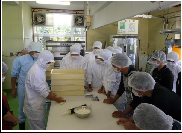
他校種参観：食品加工実習（パンづくり） 県立鶴翔高等学校