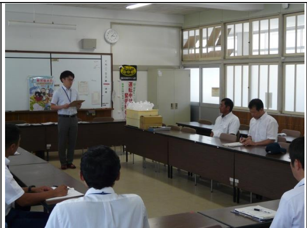
他校種参観：閉会式会場校へお礼の挨拶（初任者代表） 県立鶴翔高等学校