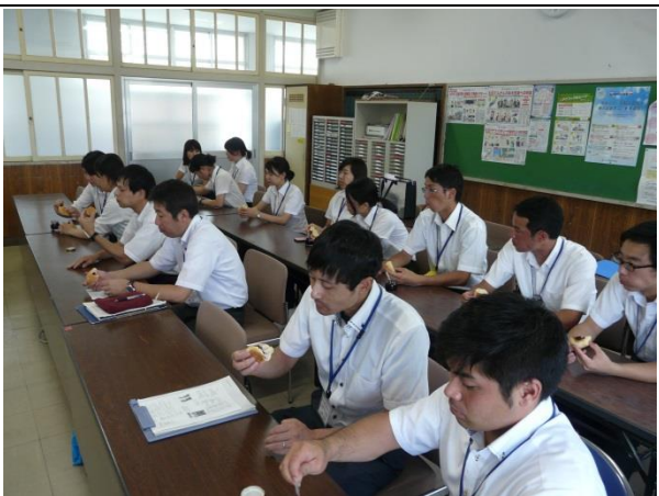
他校種参観：試食（ブルーベリージャムとパン） 県立鶴翔高等学校