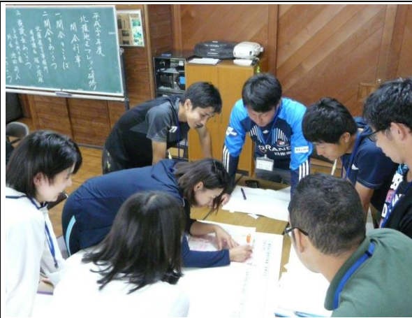
グループ協議：鹿児島島の未来を考える