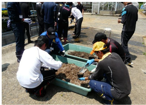
他校種参観：農業体験実習（土づくり・花づくり） 県立鶴翔高等学校