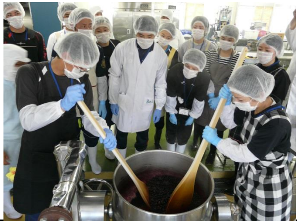
他校種参観：食品加工実習（ブルーベリージャムづくり） 県立鶴翔高等学校