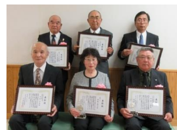
被表彰者の皆さん