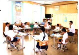
霧島市立竹子小学校

学校だよりには、「全校朝会や児童集会を体育館で実施しました。」「運動会を4年ぶりに午後まで実施しました。」などの記事が載せられています。必要な感染症対策は講じつつ、充実した活動に取り組んでいることが伺えます。 今後暑い夏を迎えるに当たり、心配になることを右図にまとめました。