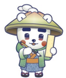
大会マスコットキャラクター かごまる