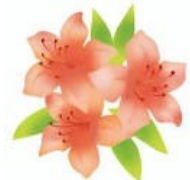
【レンゲツツジ：向上心】

「かごしま県教員等育成指標」は、「こうあってほしい」という願いも込めて、本県が求める教員等の姿を具体的に描き出したものです。教員等が、教職であることに誇りや幸せを感じ、自らも夢中になって学び続ける姿は、児童生徒の学びのロールモデルとなるものです。本県の教員等がこうした姿勢を大切に、未来社会を見据えつつ、本県が積み上げてきた教育文化や豊かな教育的資源を十分活用しながら、児童生徒一人一人の個性に寄り添い、その主体性を育む「伴走者」となることを期待します。