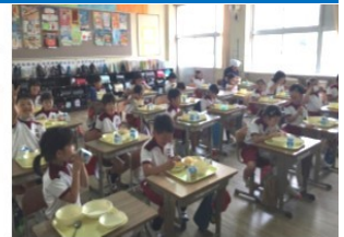
始良市立三船小学校

給食時間の様子です。友達と会話をしながら、楽しそうに食べています。子供たちの笑顔が印象的です。