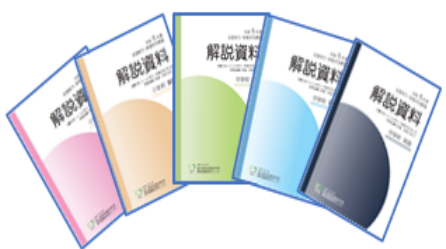
令和5年度 全国学力・学習状況調査 解説資料