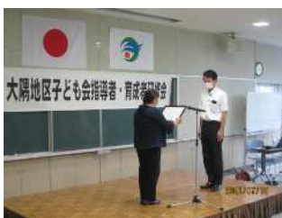
中央麓地区子ども会育成会