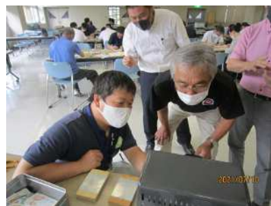
トースター内のプラ板の変化を見守る

今回の創作活動を、各市町の子ども会大会等で広めるとともに、近くにある国立大隅青少年自然の家の利用促進について確認した。