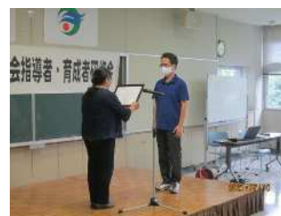
麓地区子ども会育成会