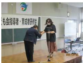
細山田子ども会育成会