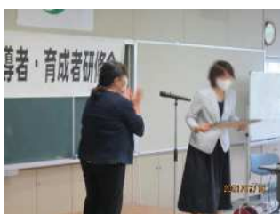
丸峯子ども会育成会