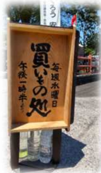
地域支援者の手作り看板