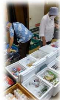
生鮮食品も買えます

地域における福祉サービスを知り、地域福祉の推進の大切さについて考えることができました。