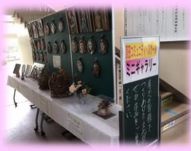
【地域の方の作品展示】

昨年度、大隅地区は34,795人の方々が参加されました。どなたでも参観できますので、子どもの姿を多くの方に見ていただきたいです。