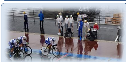
自転車競技（トラックレース）リハーサル大会が、南大隅町の根占自転車競技場で開催（R元.9.6）

大隅教育事務所としては、県や各市町の国体推進室と連携を図り、「燃ゆる感動かごしま国体・かごしま大会」開催に向けた県民の気運醸成を推進できるように各関係機関の支援や広報に努めていきます。