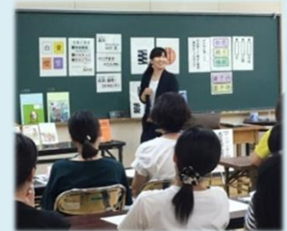
【アニメーションの実演】

参加者は、読書活動の技法を体験的に学びながら、「アニメーションを学級でやってみよう。」「紙皿シアターを読書祭りで使おう。」と、意欲を高めていました。研修の成果を、学校や家庭、地域の様々な場所で発揮していただくこと期待しています。