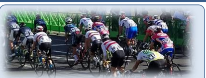
自転車競技（ロードレース）リハーサル大会が、鹿屋市、肝付町、錦江町、南大隅町にまたがる大隅広域特設ロード・レースコースで開催（R元.9.8）