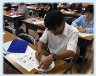
【紙皿シアターの製作】