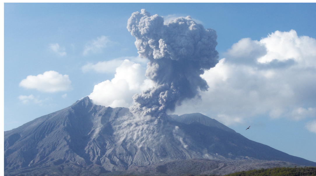
「活発な活動が続く桜島・昭和火口の噴火」(2013(平成25)年1月11日垂水市海潟より撮影)

桜島は今から約2万6千年前に始良カルデラの南側にできた火山です。歴史時代に入ってから天平宝字、文明、安永、大正、昭和などの溶岩流を伴う大きな噴火を記録しています。桜島は、2014(平成26)年1月12日には、大正噴火から100年を迎えます。