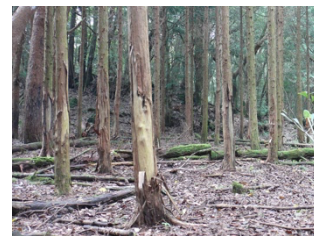
ヒノキの食害(霧島市)

また、数が増えたことで、これまでシカが生息していない場所へ分布が拡大し、希少な植物を含む森林生態系に大きな影響をおよぼし始めました。