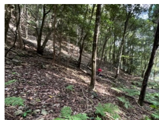
シカにより下草が食べ尽くされた森(さつま町)