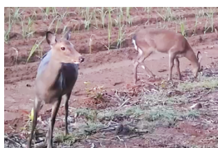
マゲシカ(南種子町)

種子島の西方約10kmにある馬毛島と、種子島に生息します。体の大きさはキュウシュウジカとヤクシカのほぼ中間です。