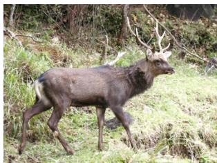
キュウシュウジカ(霧島市)

ニホンジカの中では中程度の大きさです。出水市や伊佐市、霧島市の山地や、鹿児島市八重山などで生息密度が高くなっています。