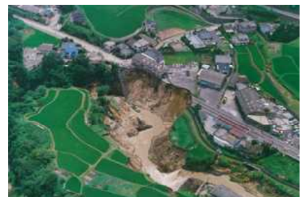
平成5年8月豪雨による土砂災害

台風や集中豪雨,長雨などによって、河川の氾濫や土砂による災害が発生しやすくなります。特に、県本土は急峻な崖を形成するシラス台地や火山灰や軽石が堆積した地層,花こう岩が風化したマサなど土砂災害が発生しやすい地形・地質なので、